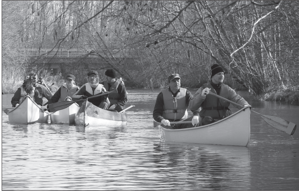
Vabatahtlikud türlased koristavad Türi valda läbivate jõgede kaldaääri kolme nädala jooksul. Ettevõtmist toetab Keskonnainvesteeringute keskus.

Kuigi järve tagant möödud jõe- käär pole ülipikk, kulus enam kui kümnel kanuul selle läbimiseks tükk aega ja tööd. Põhjuseks jõe- kallast palistav prügilasu, mis oli kogunenud sinna eelmisest suvest saadik. Kõikvõimalikku sodi olid maha jätnud puhkajad, jalutajad ja suure töönaosusega ka kalame- hed. Ühte kalameest me kaldal ää- res õngitsemas ka silmasime. Mees polnud koristajate suhtes sugugi sõbralikul meelestatud, sest palve peale kaldalt mõned pudelid kok- ku korjata ja kanuusse heita, kos-