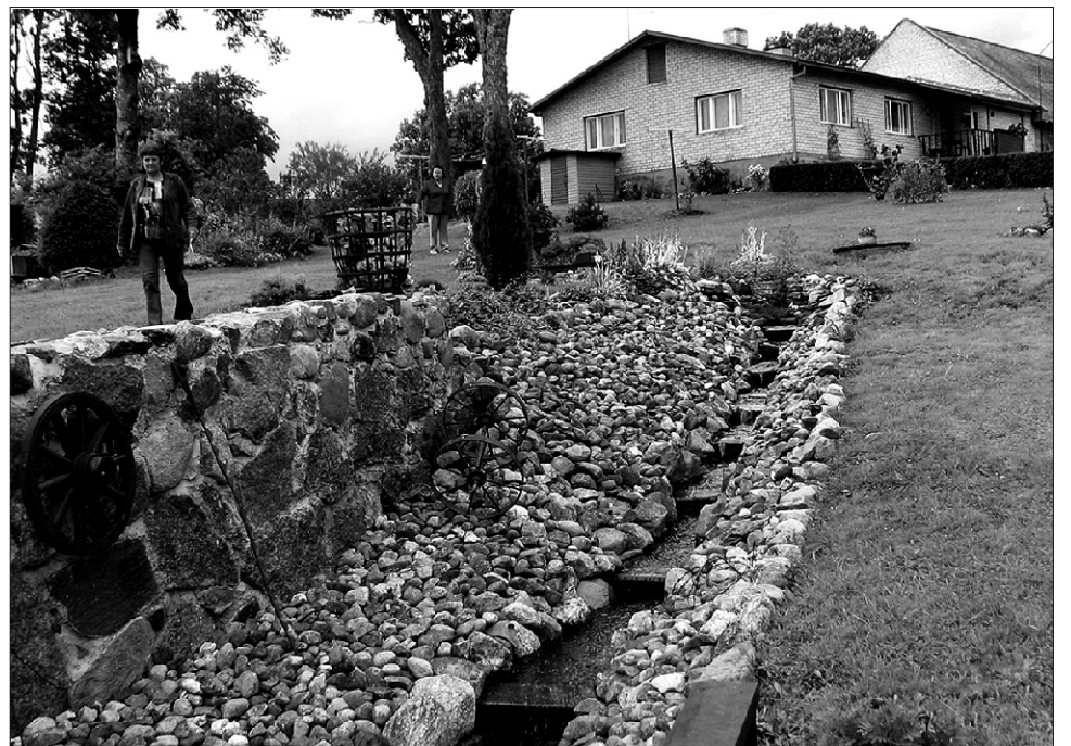
Maakodudest sai esimese koha Aasa