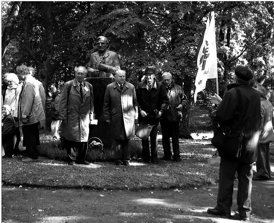
Suure-Jaani Gümnaasiumi vilistlaste kokkutulekul osalejad Kondase mälestustähise juures grupipilt tegemas.