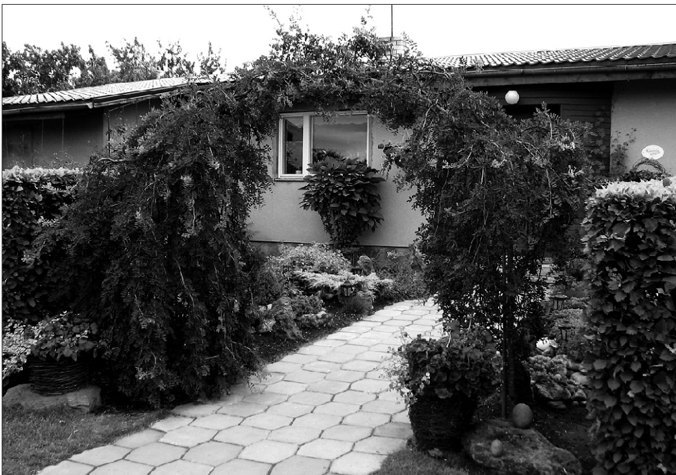
Elamute hulgas esimese koha võitnud Kirsi 6 Sürgaverest

Kokku osales konkursil „Kaunis Kodu 2007“ eramuid 6, korterelamuid 2, maakodused 12 ning sotsiaal- ja ühiskondlikke hooneid 1. Parimate valimine ei olnud ziiriile sugugi kerge ülesanne, sest kodud on muutunud eripalgelisteks ja omanäolisteks ning premeeritud sai seepärast algul kavandatud enamgi.