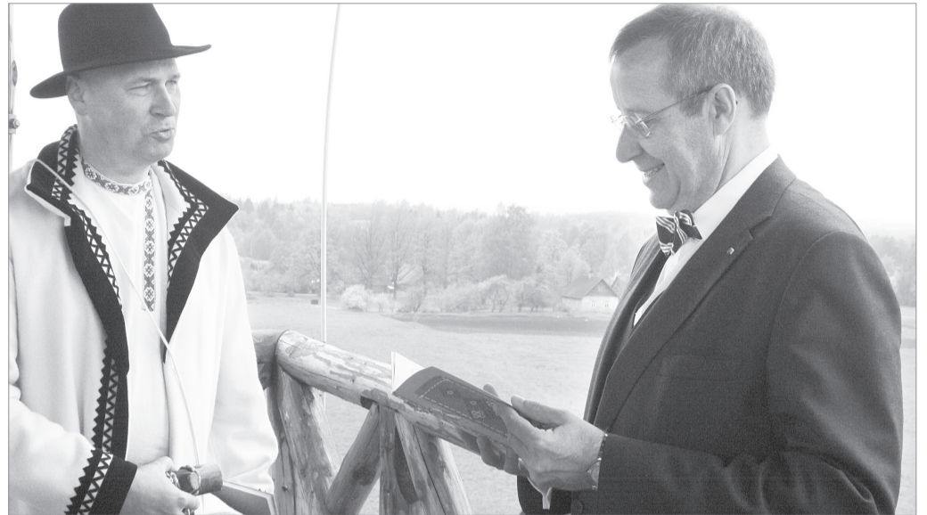
TULEB JÄLLE: presidendil oli kutse üle hea meel ning ta lubas peagi tagasi tulla.