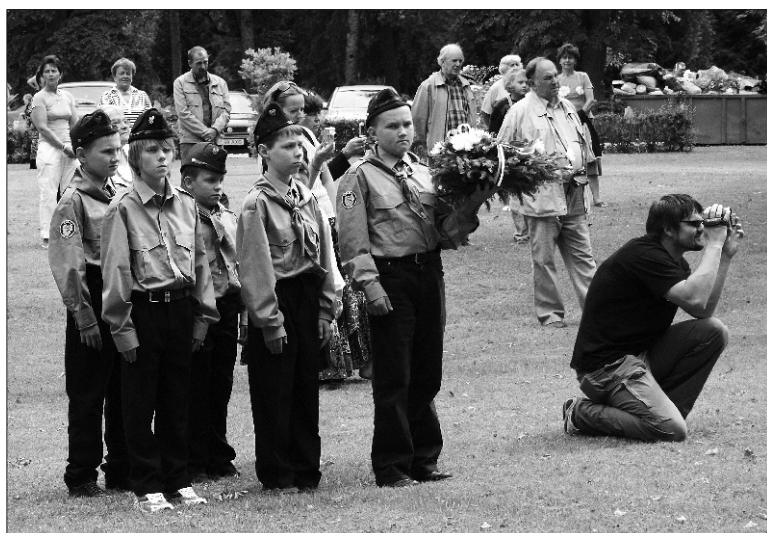
Võidupäeva aktusel Lembitu juures