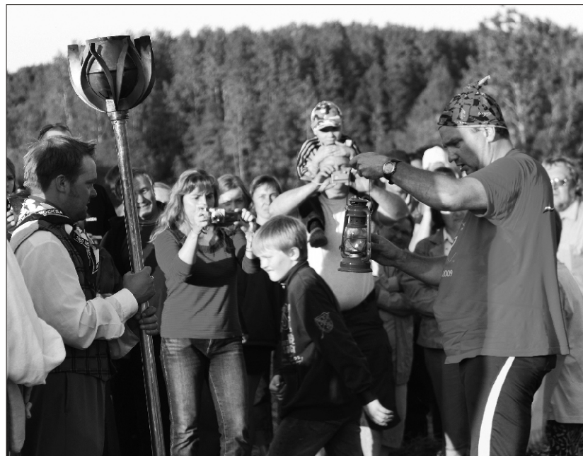
Sellises tormilaternas sõitis tuli haabjas

Öerutajatega sai lihtsamaid tantse kaasa tantsida