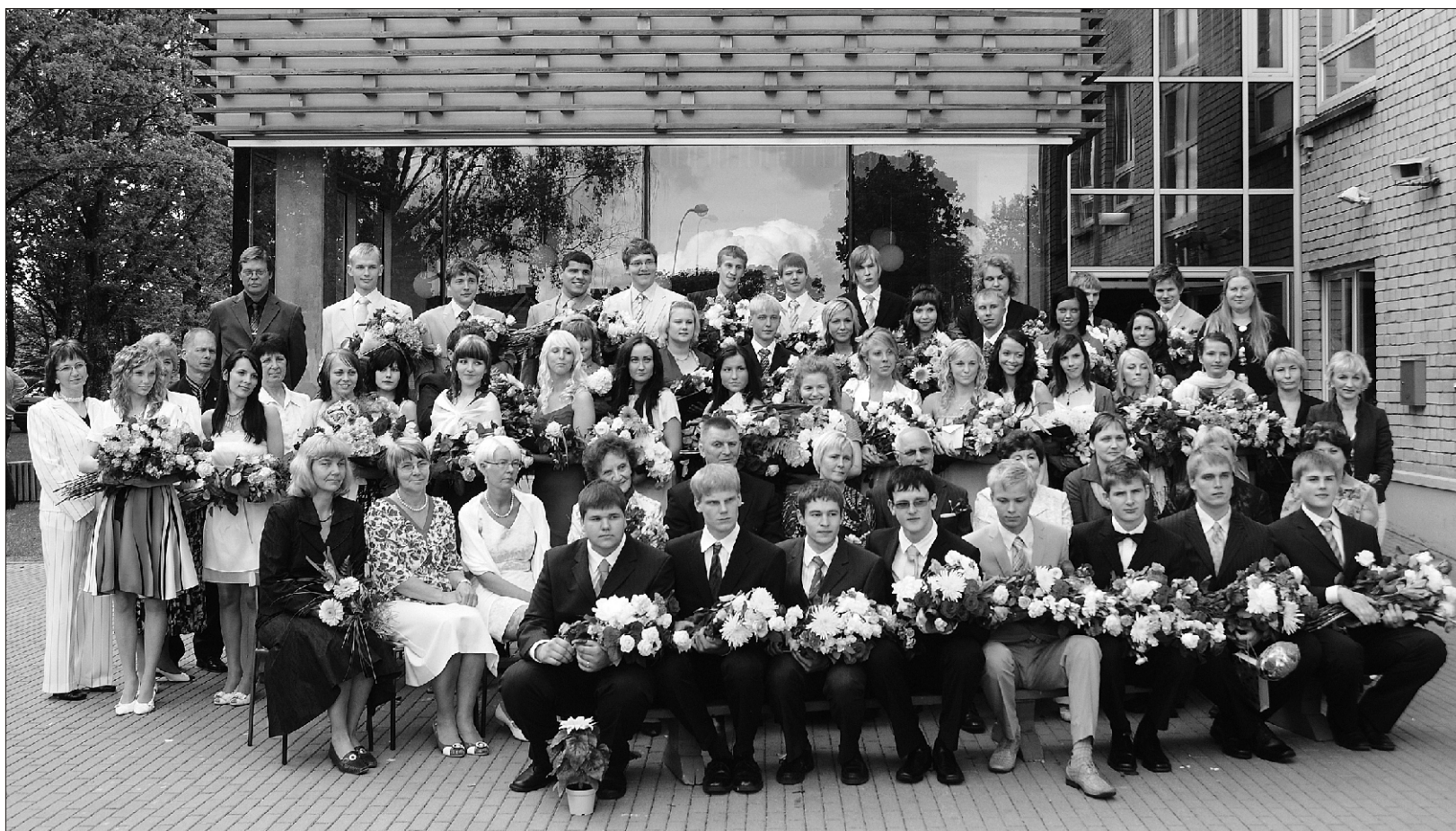
Suure-Jaani Gümnaasiumi lõpetanud ja õpetajad