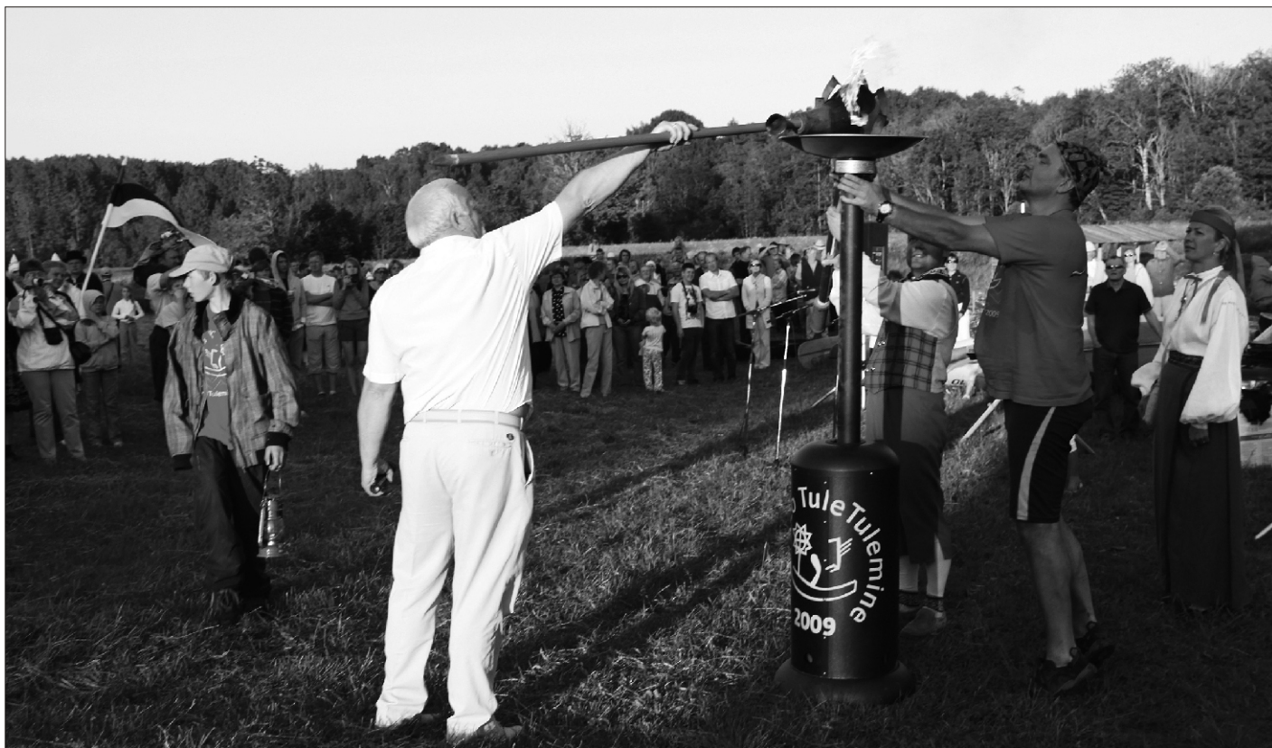
Kohe süttib laulupeotuli tulealuses