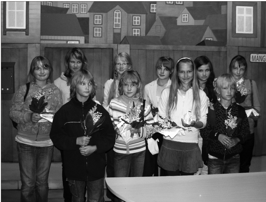
Näidendite kirjutajad Eesti Nukuteatris