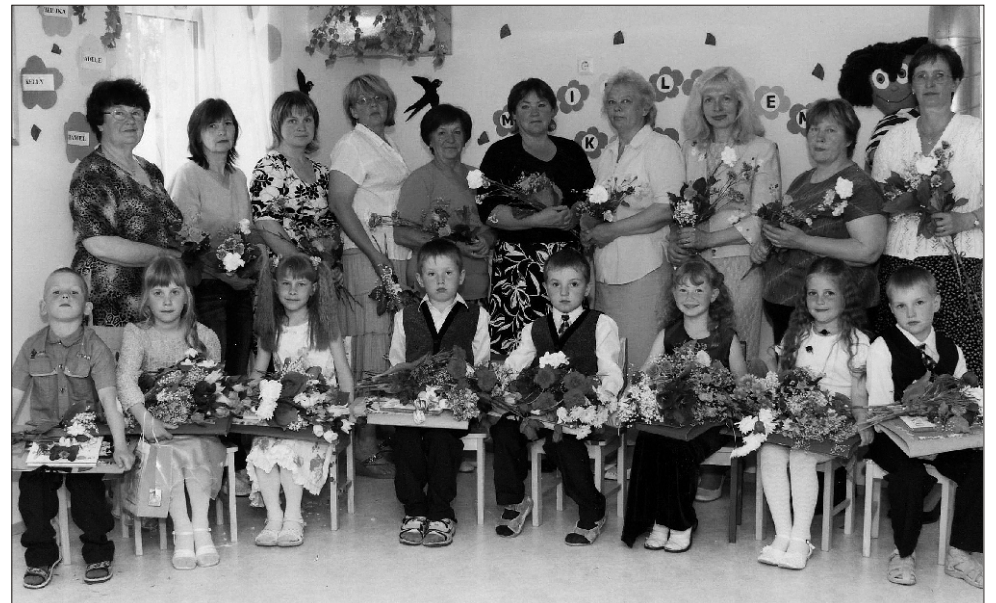
Sipsiku pere ja lõpetajad