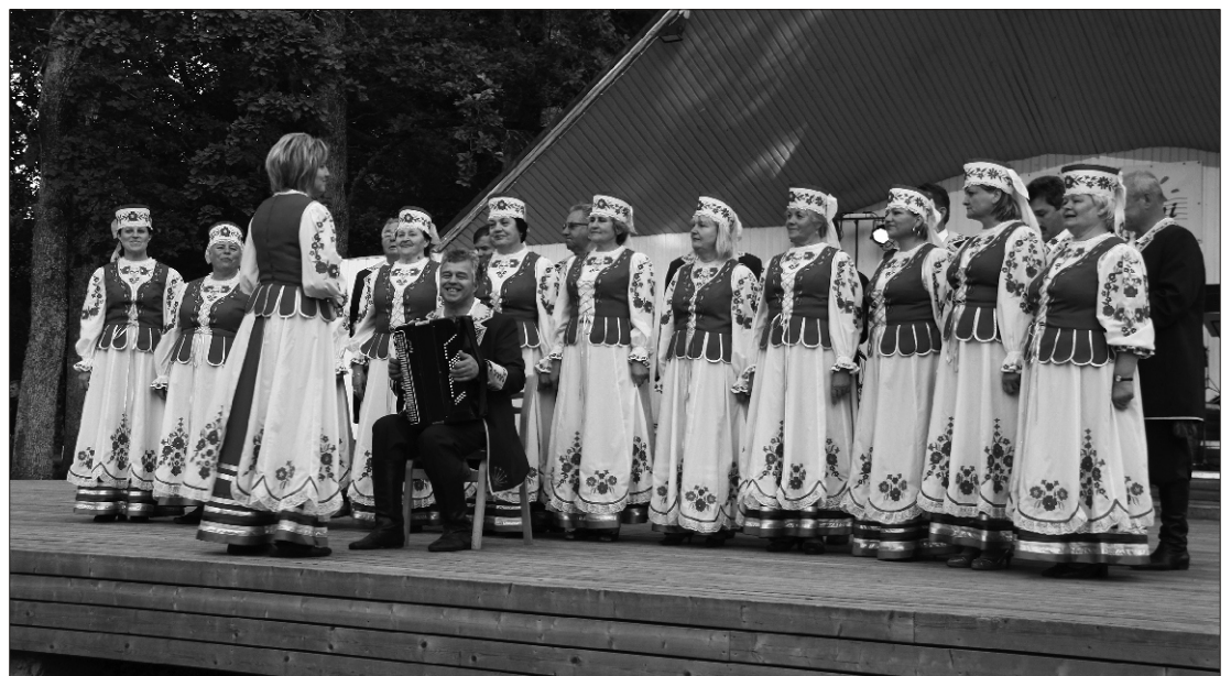
21.-24. juunil olid Suure-Jaanis külas lauljad Hajnowkast - koor Echo Puszczy. Külakosti pakuti meie valla jaanipidudel Lubjassaares ja Suure-Jaanis. Echo Puszczy Suure-Jaani laululaval.