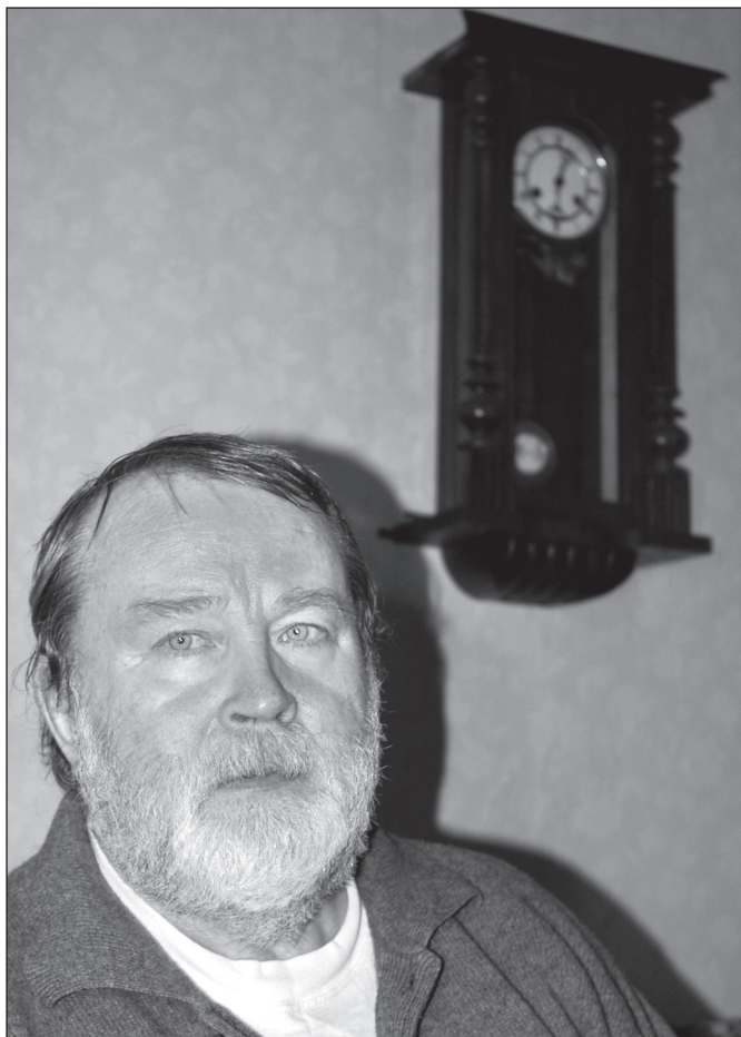
Kalkuna Mati ja vanaesä kell.