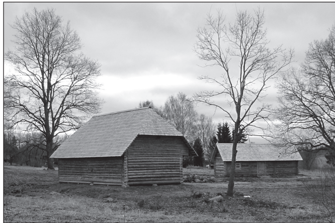
PARHOMENKO EDUARDI PILT

Hurda kodotalo inneskides tegemise komitee toimõndas edesi – hulk Hurda perändü-sega köüdetüid mõttit uut viil teos tegemist.