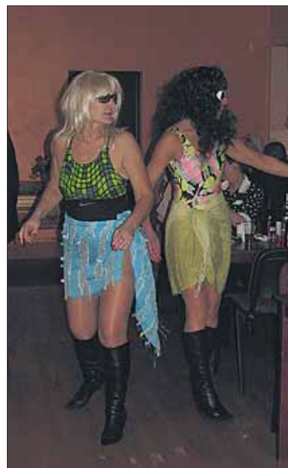
● Naistepäevapidu oli meeldejääv. Üllatuskülalised olid tõelised üllatu- sed! Miks? Järgmine kord tule peole, siis veendud ise.