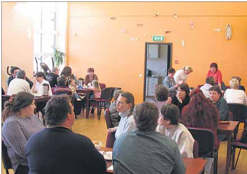
● Mälumängijaid sai külamaja saal täis. Võitis korteriühistu «Kroon» võist- kond.