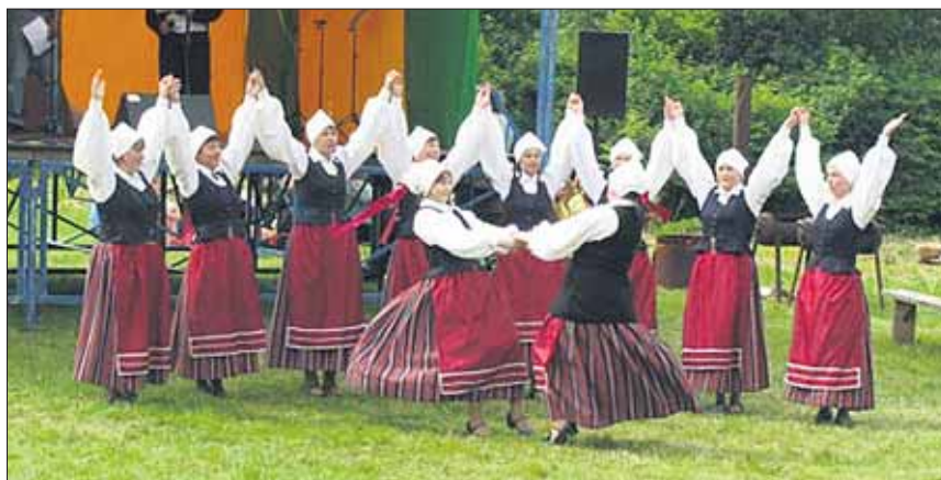
● «Kaheksakand» tantsib Tánassilma rahvamaja juures, kus 2008. aastal peeti Võrtsjärve mängu.

2001. aastal võtsime osa kolmandast üle-eestilisest talvisest rahvatantsupeost,