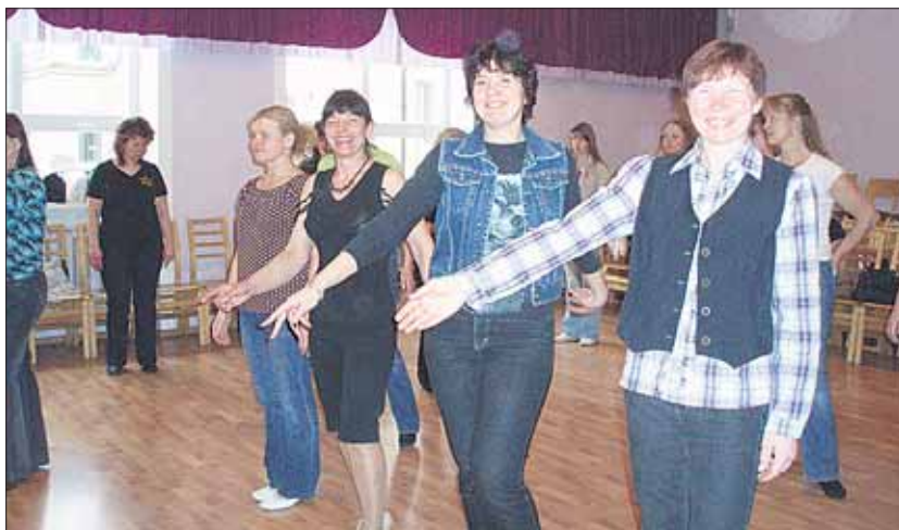
• 24. märtsil toimus Abja Gümnaasiumis line-tantsu päev, milles ka Uusna külamaja ja Tännassilma rahvamaja tantsijad osalesid. Viiratsi vald oli ainuke, kust oli väljas kaks truppi.