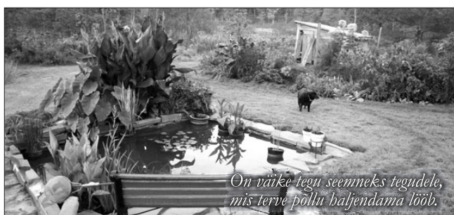
On väike tegu seemnaks tegudele, mis terve põllu lahendamata loob.