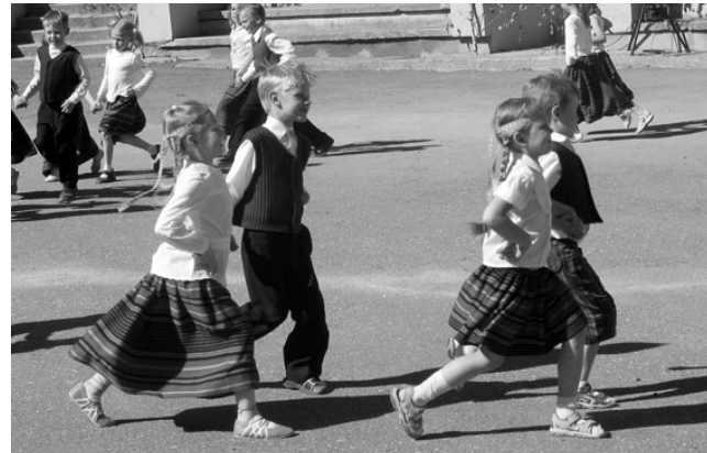
Väikesed Õnneseeene lasteaia tantsijad ei saanud ka suurtele tantsimises kuidagiviisi alla jääda.