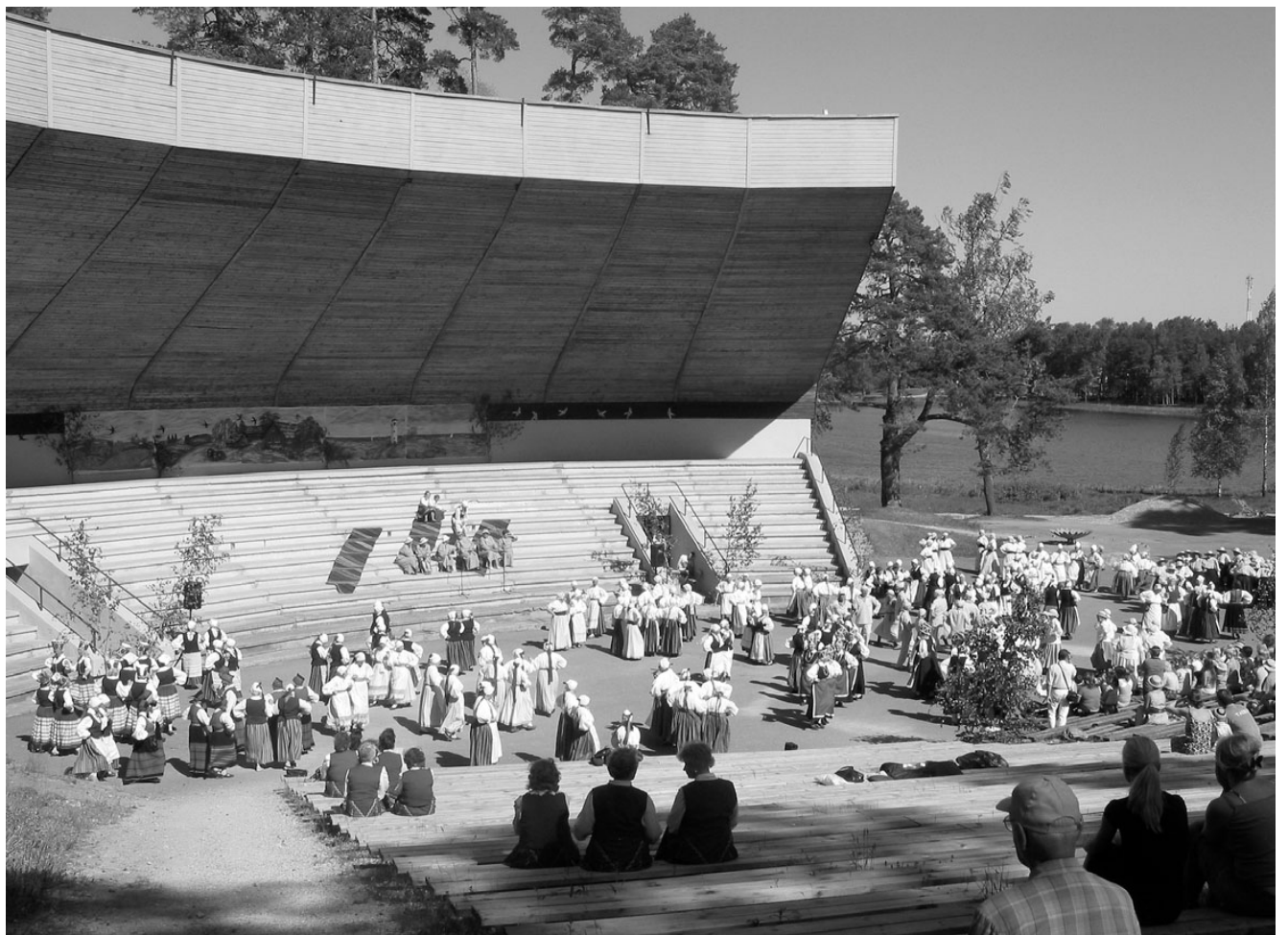
...ja nii uhkelt lai sai tantsukaar.

Fantastiline, et meil Elvas on nii toredaid inimesi, põnevaid juhte ja eestvedajaid. Inimesed käivad koos, muredest hoolimata ja teevad rahvakultuuri, mis on inimesi ajast aega elus hoidnud.