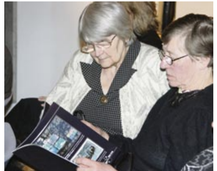
Raamatu esitlusele oli märgata, et trükis pakub kunstisõpradele suurt huvi.