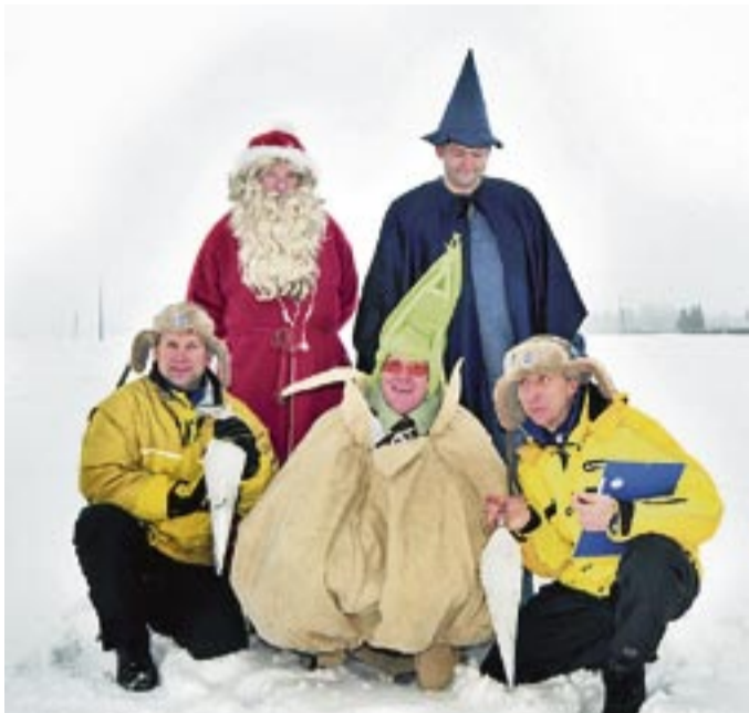
Üritusel „Jääpurikas 2009“ said kokku Külmalinna Jõgeva head sõbrad - Jõuluvana, Mr Küüslauk, Kül-mamees ja Jääpurikamehed.