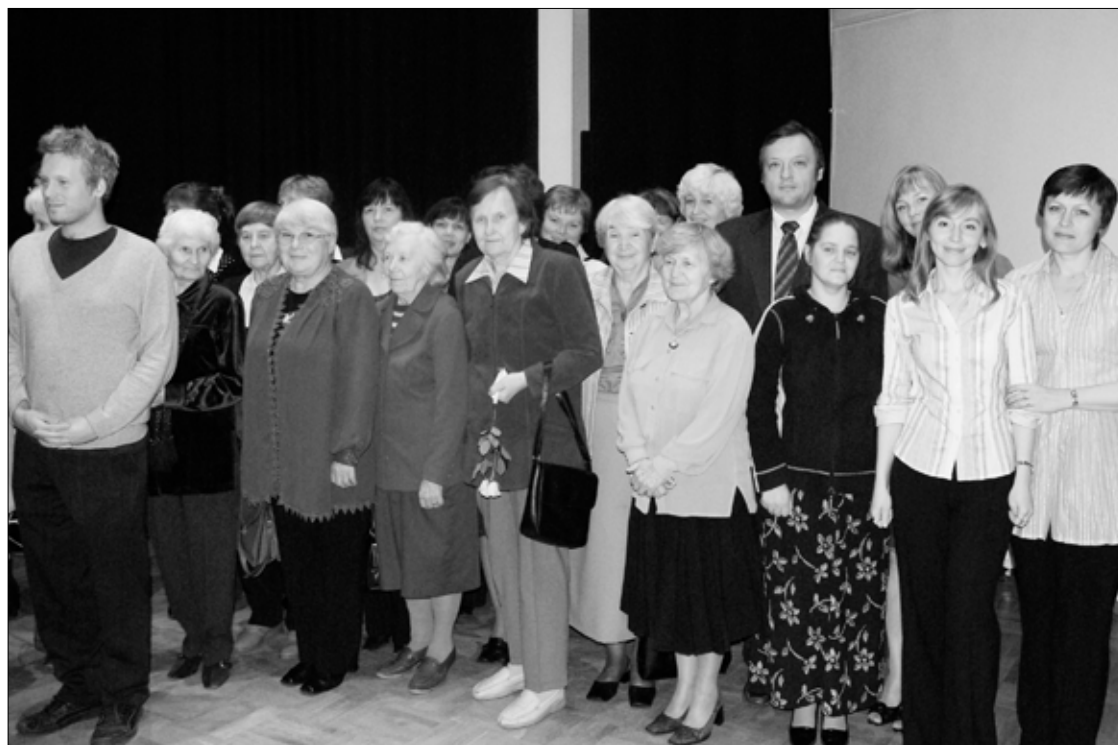
Meenutus 2007. aasta õpetajapäeva tähistamiselt Tapa kultuurikojas.

T: 10–12; 14–18 N: 10–12; 14–18 L: 10–14 Telefon 322 0060