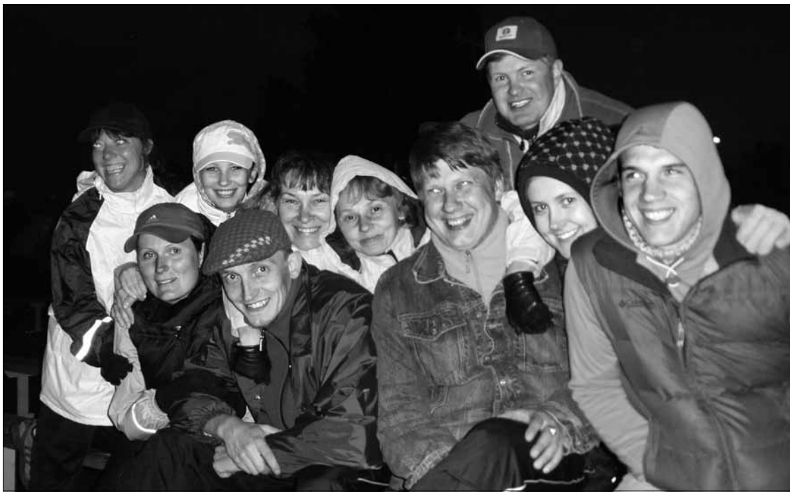
Tulised Tuulutajad Kasepää tantsupeol.