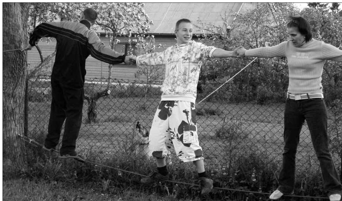
Meeskonnakoolitus viidi läbi seigeldes seiklusrajal.