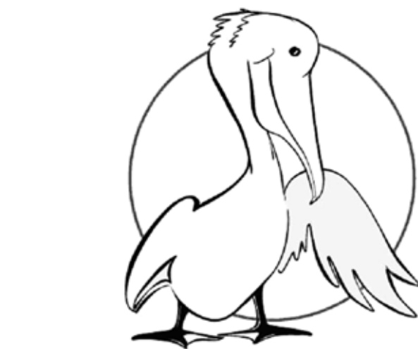
Legendi järgi oli pelikan maailma esimene doonor

Doonoripäeva külastamiseks tuleks varuda umbes 45 minutit, millest vereloovutus võtab 5 kuni 10 minutit ning ülejäänud aeg kulub ankeedi täitmisele, meditsiinilisele läbivaatusele ning väikesele puhkusele pärast vereandmist. Vereandmine on valutu ja ohutu protseduur, mille käigus võetakse doonorilt 450 ml verd. See moodustab kõigest 8% kogu täiskasvanu inimese verest. Vere maht taastub kohe, vererakkude