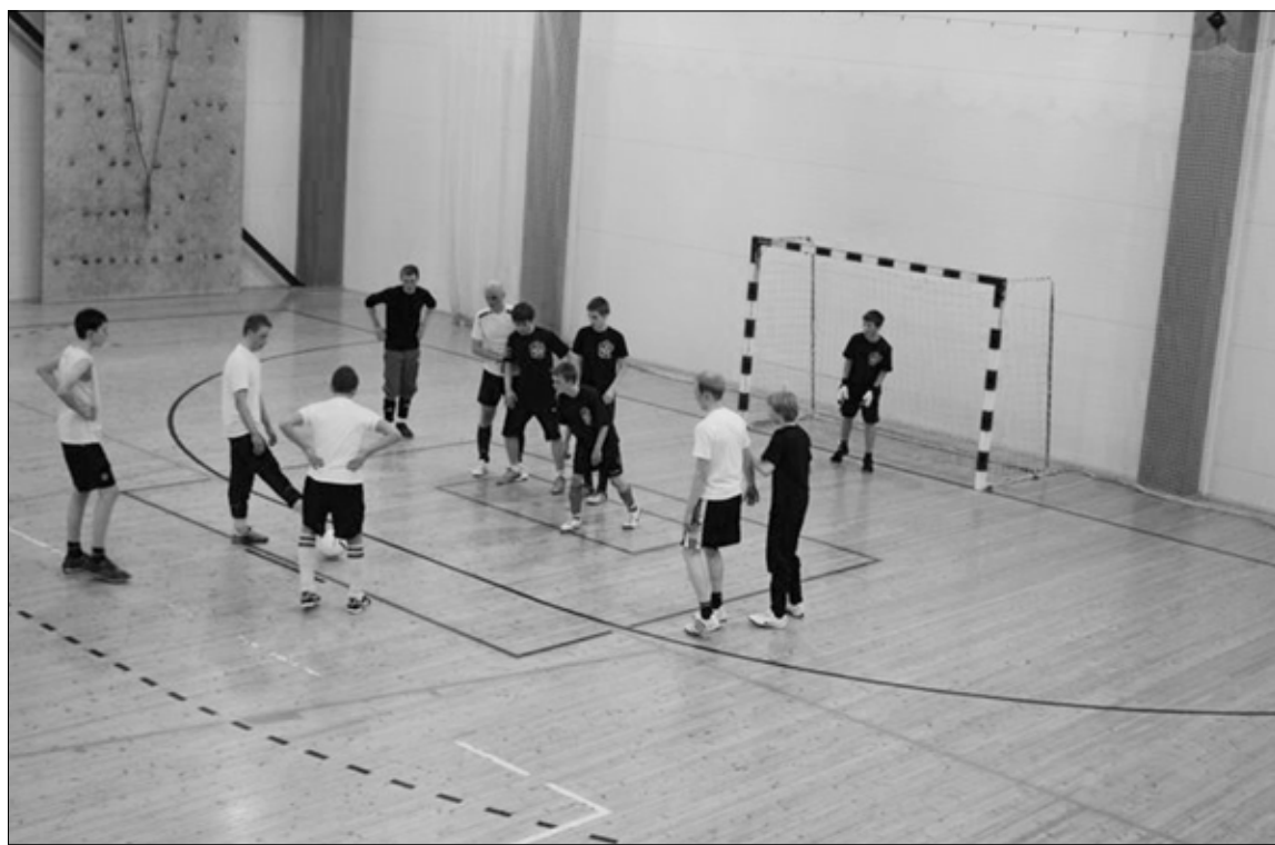
Poisteklubi jalgpallivõistlus Tapal.

Nb! Jälgige reklaame! Info ka Tapa valla kodulehel – www.tapa.ee