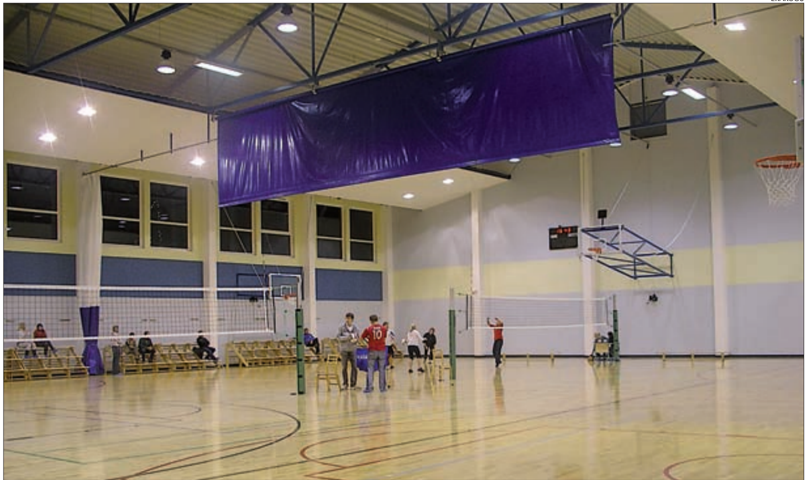
Kuusalu spordikompleksi võimla.

Võime olla rahul, et peretoetuste maksimise põhimõtteid ja vanemapalka kärped ei puuduta. Lastega perede kindlustunne on ebakindlatel aegadel kõige olulisem. Ka pensionitõus tuleb, tõsi, veidi väiksem kui algselt kavandatud. Kokkuvõttes avalikus sektoris on kindlasti nii vajalik kui ka võimalik. Lisaks on olemas kava, mida edasi teha, kuidas majandus ümber korraldada, kriisist väljuda. Selle elluviimisel saavad kaasa lüüa kõik.