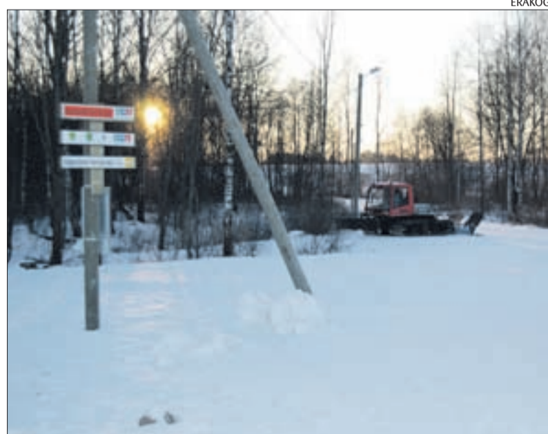
Kuningamäe valgustatud terviserada