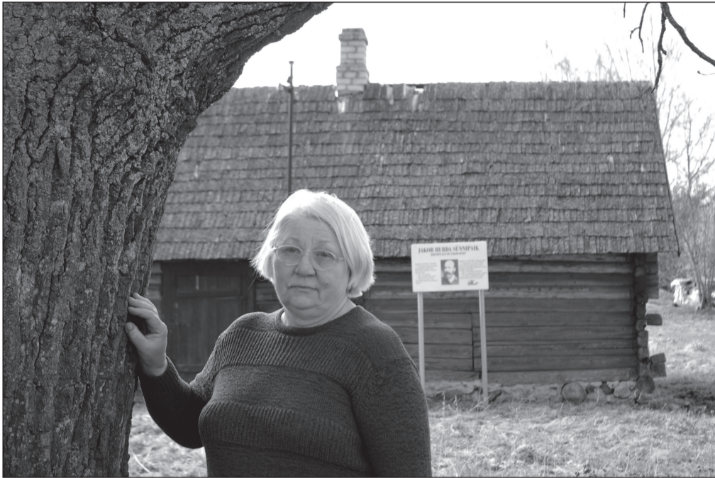
HARJU ÜLLE PILT