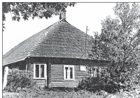
Hurda kodotarõ, miä 1975. aastagal är palli.

Inne tahami tetä huunilõ väikut iloravi, selle et 25. hainakuul piämi Lepä talon Hurda Jakobi 170.