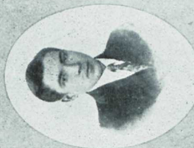
R. Ode. (kirjatoimetaja)