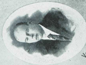
Karm. adv. H. Losses.