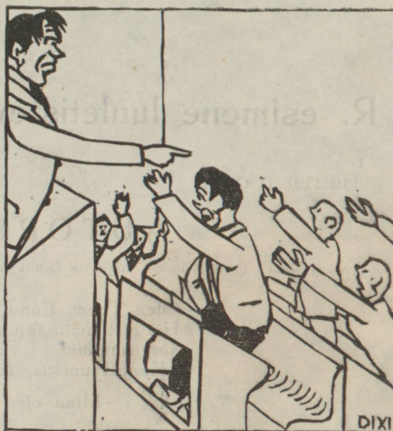
Vaidluskoosolek teemal: „Õpilane ja sport.“

viimase kl. õpilasi, mis tuleb osalt ka sellest, et abituriumist liikmete protsent järjest on tõusnud, jõudes aastapäevaks 100%-ni. Üldse oli 9. aastapäeval E. R. koosseis järgmine: