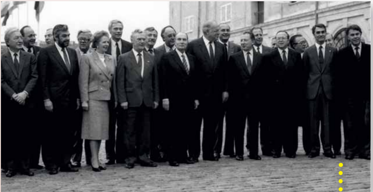
Esimene Euroopa Ülemkogu kohtumine pärast ühtse Euroopa akti jõustumist, 4.-5. detsember 1987, Kopenhaagen.

Lisaks sellele sätestati Euroopa Liidu lepinguga Euroopa Ülemkogu roll institutsioonidevahelistes suhetes. Kõnealuse lepinguga muudetakse ametlikuks tava, et Euroopa Ülemkogu kohtumist juhatab nõukogu eesistumist teostava liikmesriigi riigipea või valitsusjuht. Lisaks Euroopa Parlamendi volituste suurendamisele nähakse lepinguga ette, et Euroopa Ülemkogu esitab iga kohtumise järel parlamendile aruande ning kirjaliku aastaaruande liidu edusammude kohta.