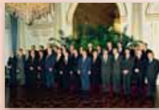
Esimene Euroopa Ülemkogu kohtumine pärast Maastrichti lepingu jõustumist 10.–11. detsembril 1993 Brüsselis

Euroopa Ülemkogu ülesanded määratakse kindlaks Euroopa Liidu lepingus (Maastrichti leping)