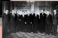
Ühisfoto 10.–11. märtsil 1975 Dublins

„[...] Majandusliidu saavutamiseks oli kõigepealt tarvis naasta võimu juurde [...] ja alles seejärel hakata otsima viise täiuslikuma ja sügavama liidu loomiseks [...]“ Jean Monnet lõpetas oma memuaarid 1976. aastal Euroopa Ülemkogu pühendatud peatükiga.