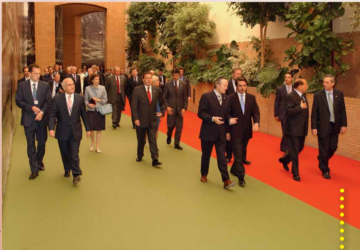
Euroopa Ülemkogu Sevilla kohtumine, 21. juuni 2002

tuseks 2006. aasta juunis Austria eesistumisel toimunud Euroopa Ülemkogu kohtumisele seati riigipeade ja valitsusjuhtide poolt Rooma lepingu 50. aastapäeva puhul vastu võetud Berliini deklaratsioonis eesmärk luua Euroopa Liidu jaoks uus ühine alus enne 2009. aastal toimuvaid Euroopa Parlamendi valimisi. 2007. aasta juunis Saksamaa eesistumisel toimunud Euroopa Ülemkogu kohtumisel lepidi kokku olemasolevate aluslepingute muutmiseks kokku kutsutava valitsustevahelise konverentsi mandaadis. Selle tulemusena koostatud leping allkirjastati 13. detsembril 2007 Lissabonis.