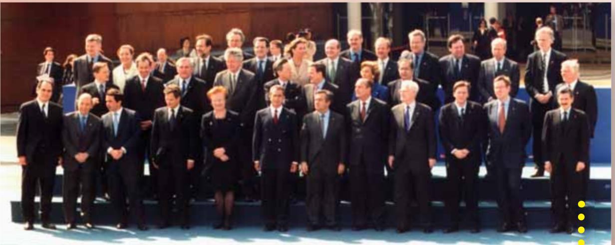
Ühisfoto, 23.-24. märts 2000, Lissabon

Pärast Amsterdami lepingu jõustumist otsustati 1999. aasta oktoobris Tamperes toimunud Euroopa Ülemkogu erakorralisel kohtumisel, mis oli pühendatud vabadusel, turvalisusel ja õigusel rajaneva ala loomisele Euroopa Liidus, luua Euroopa ühine varjupaiga- ja rändepoliitika, avades sellega tee olulistele arengutele politseikoostöö ning õigusalase koostöö valdkonnas.