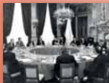
Tõistusting 9.–10. detsembril 1974 Parisis