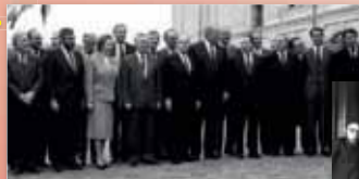
Esimene Euroopa Ülemkogu kohtumine pärast ühtse Euroopa akti jõustumist 4.–5. detsembril 1987 Kopenhaagenis

Euroopa Ülemkogu sätestatakse ühtses Euroopa akts