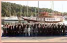
Ühisfoto 19.–20. juunil 2003 Thessalonikis

Euroopa Ülemkogu lohtub viimast korda eesistujariigis, praegu toimuvad kohtumised Brüsselis