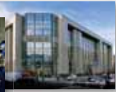
Justus Lipsiuse hoone: Euroopa Ülemkogu praegune asukoht