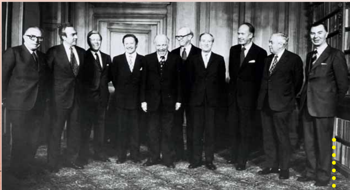
Ühisfoto, 10.-11. märts 1975, Dublin

Ülemkogu loomise tingis „vajadus näha ette üldine lähenemisviis Euroopa ülesehitusega kaasnevatele siseprobleemidele ja Euroopa välistegevuses ette tulevatele probleemidele” 4 . Seega tehti Euroopa Ülemkogule ülesandeks olla poliitilise impulsi andjaks ühenduse ja poliitilise koostöö valdkonnas. Riigipead ja valitsusjuhid ning välisministrid kohtuvad edaspidi „kolm korda aastas ja iga kord, kui see on vajalik” 5 .