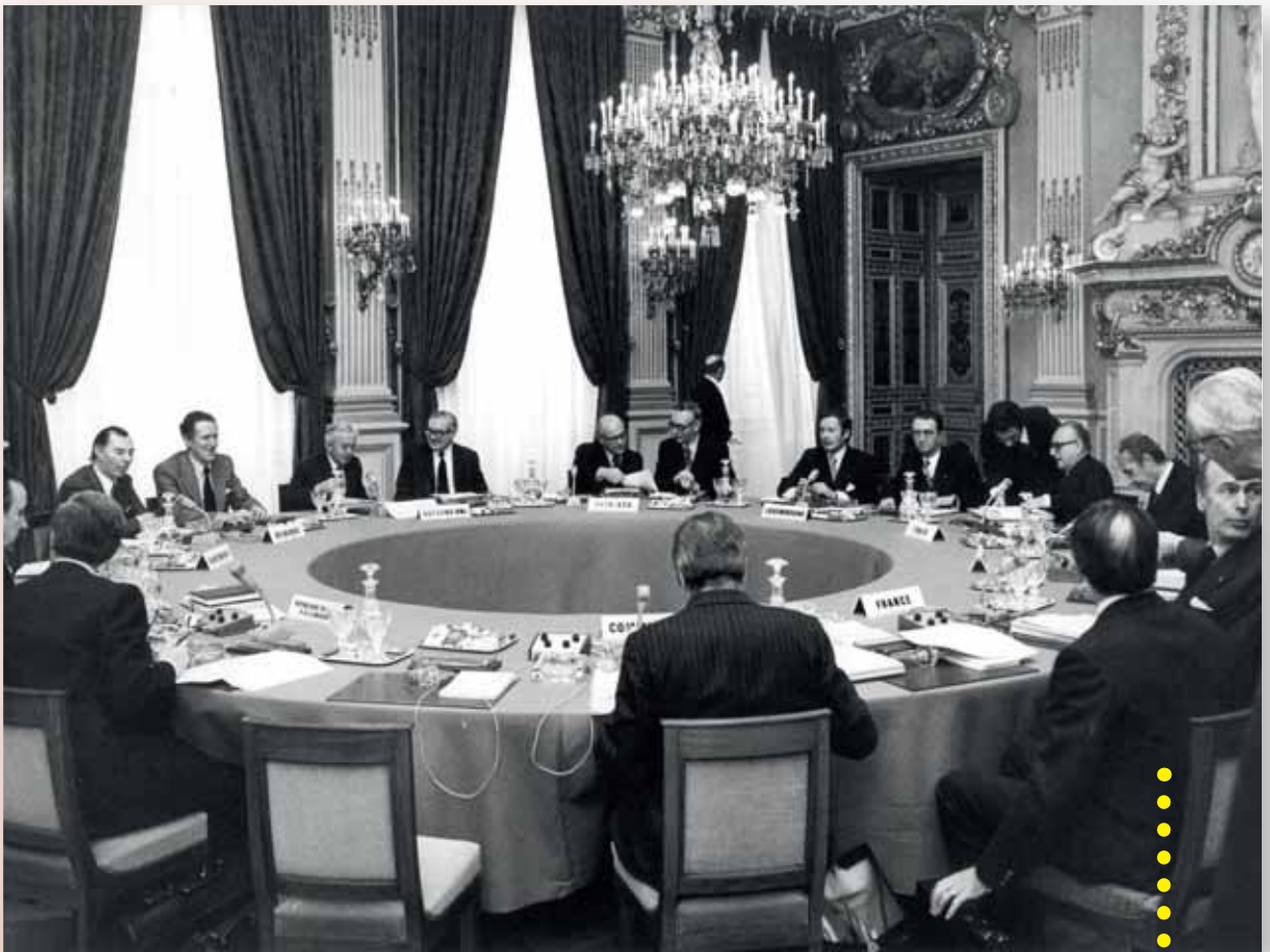
Tööistung, 9.-10. detsember 1974, Pariis

1969. aastal Haagis toimunud kõrgetasemeline kohtumine, kus osales esmakordselt ka komisjon, võimaldas ühendusel oma tegevuse taaskäivitada. Tänu sellel kohtumisel tehtud otsustele sai eelkõige võimalikuks võtta vastu ühendusele omavahendite andmise otsus, algatada koostöö välispoliitika valdkonnas (esimese Davignoni raportiga algatatud Euroopa poliitiline koostöö) ning võtta ühendusse Taani, Iirimaa ja Ühendkuningriik. Nende samude ühiseks nimetajaks sai „lõpuleviimine, süvendamine ja laienemine”. Kolme uut liikmesriiki kutsuti osalema 1972. aasta oktoobris Pariisi kõrgetasemelisel kohtumisel, kuigi ametlikult ühinesid need riigid alles 1973. aasta jaanuaris.