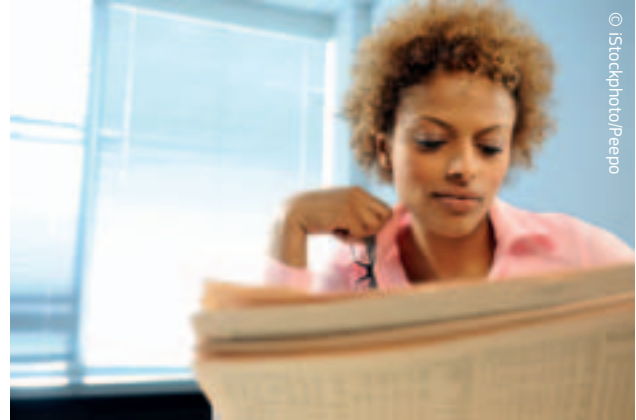
Euroopa vajab uusi ettevõtjaid.

Järgmistel aastatel on komisjoni eesmärk anda Euroopas oma panus sotsiaalsetesse ettevõtetesse (ettevõtted, kes esindavad ühenduse sotsiaalseid, ühiskondlikke ja keskkonnaalaseid huve ega ole suunatud üksnes kasumi saamisele) ning sotsiaalmajandusse tervikuna. ELil võib samuti olla roll interneti teel toimuva ühisrahastamise edendamisel, et aidata lahendada väikeettevõtjate ja idufirmade rahastamisprobleeme. 2013. aasta juunis korraldas komisjon esimese seminari, et uurida erinevaid ühisrahastamisega seotud küsimusi ning võtab järelmeetmeid võimalikke poliitikaalgatusi hõlmava uuringu raames.