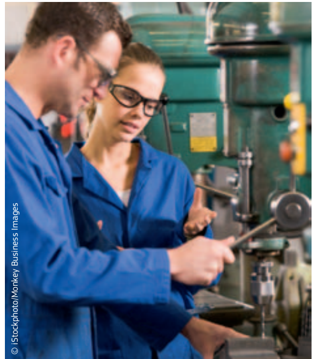
Euroopa tööstus on konkurentsivõimelisem, kui ettevõtjad saavad oma tooteid müüa kogu ühtsel turul.

Töötajate liikuvuse parandamine ELis oli samuti esimese ühtse turu meetmepaketi üks prioriteetidest, arvestades seda, et mitmed kõrge kvalifikatsiooniga töötajate ametikohad jäävad täitmata. Komisjon tegi ettepaneku Euroopa kutsekaardi kehtestamiseks, mis aitab üksikisikul taotleda oma kutsekvalifikatsioonide lihtsamat ja kiiremat tunnustamist kõikjal ELis.