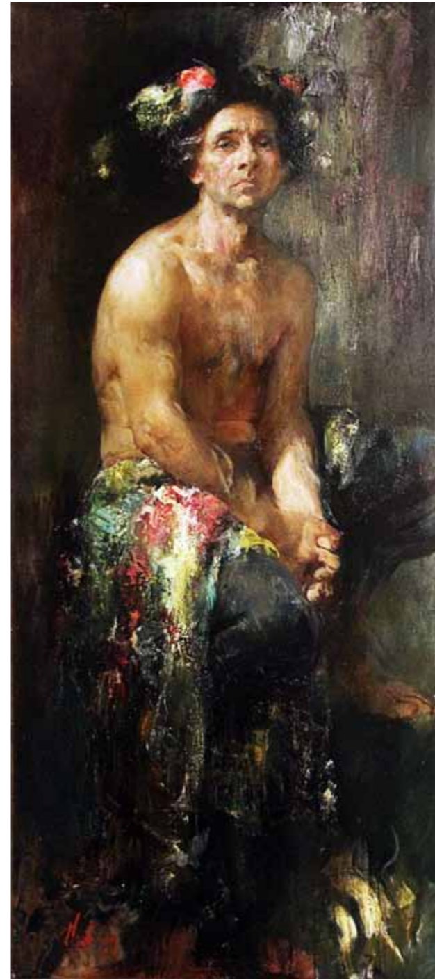
„Arlekiin“ · 190 x 84 cm · lõuend, õli · 2002 a.

Näitusel saab näha Blohhini töid „Arlekiin“ ja „Portree“, vastavalt aastatest 2002 ja 2012.