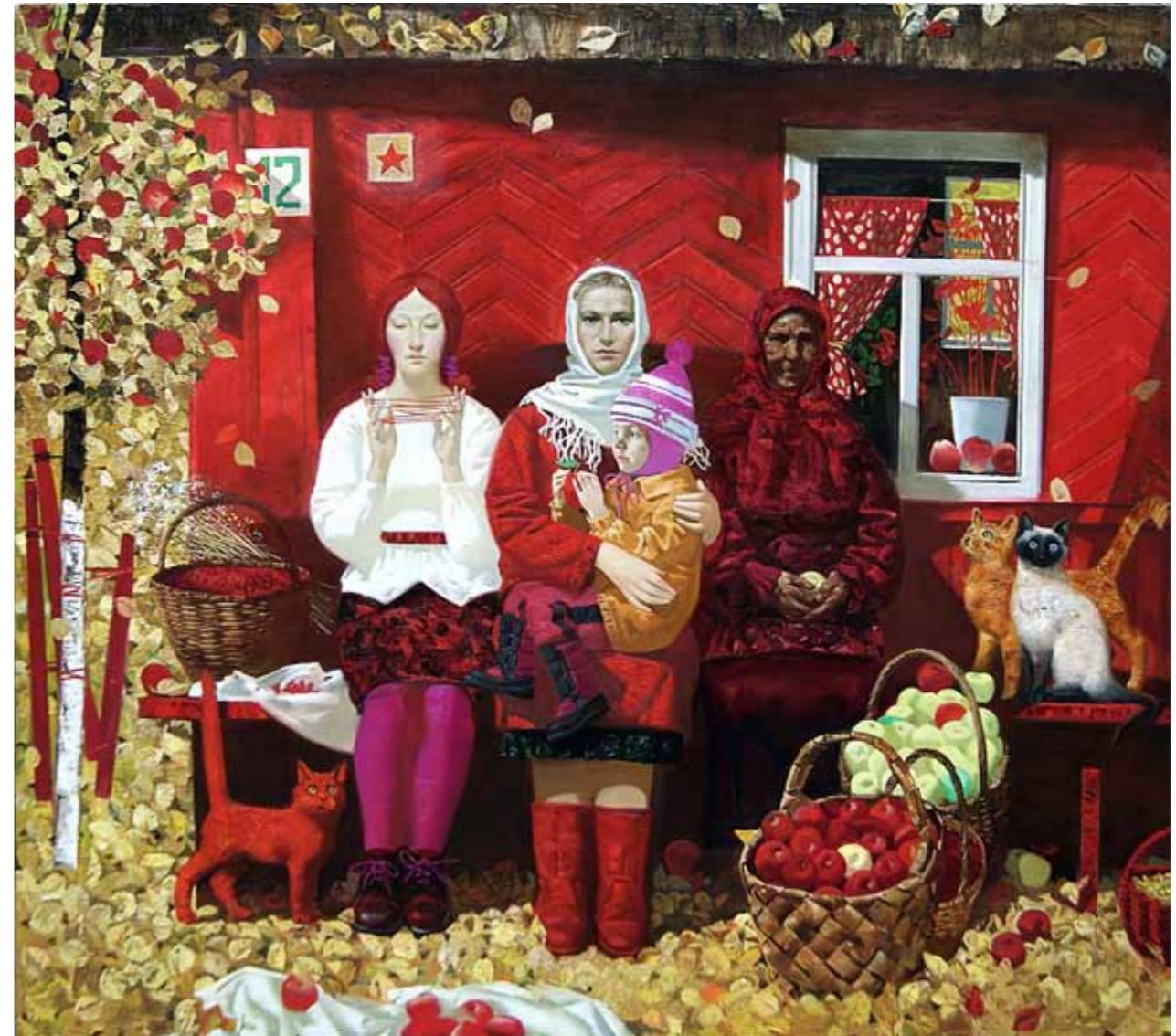
„Sügis maal“ · 120 x 90 cm · lõuend, õli · 2012 a.