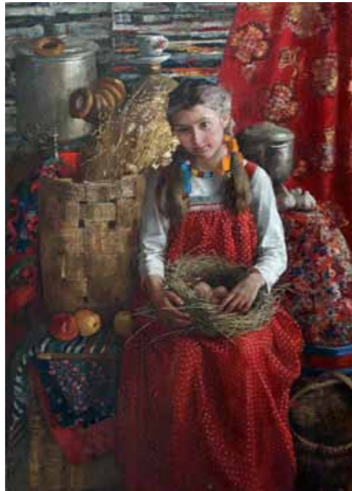
„Samovari juures“ · 160 x 110 cm · lõuend, õli · 2008 a.

Konkursi International Portraits Association (USA) finalist. 2006. aastal osales Almatõs toimunud näitusel, aastal 2008 näitas oma töid San-Diegos, järgmisel aastal Santa-Fes. Näituste koguarv, kus Milaševitš oma töödega käinud on, ületab arvult kolmekümmet.