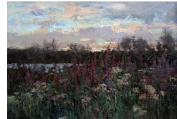
„Õhtu“ · 44 x 60 cm · lõuend, õli · 2004 a.