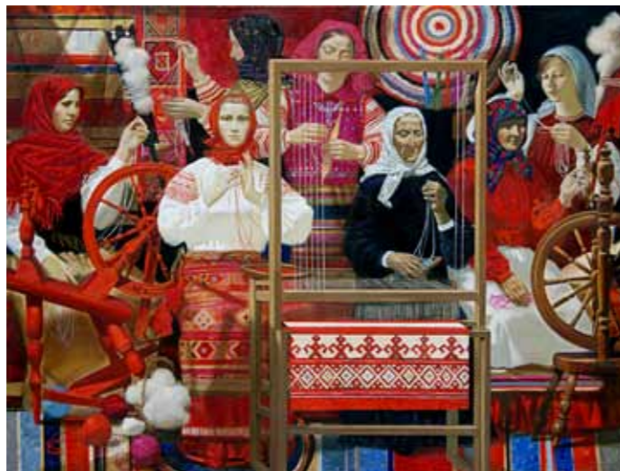
„Kangrud“ · 139 x 189 cm · lõuend, õli · 2012 a.

Näitusel on väljas 2 Novosjолоvi tööd aastast 2012 „Kangrud“ ja „Sügis maal“.