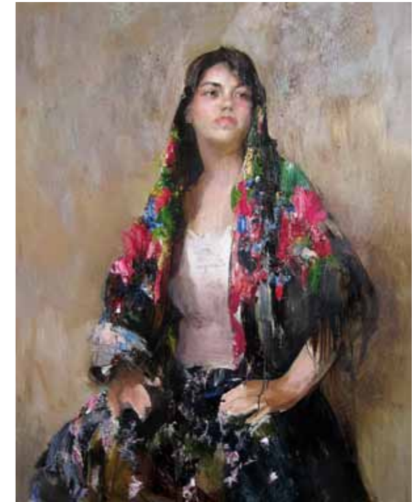
„Portree“ · 120 x 90 cm · lõuend, õli · 2012 a.