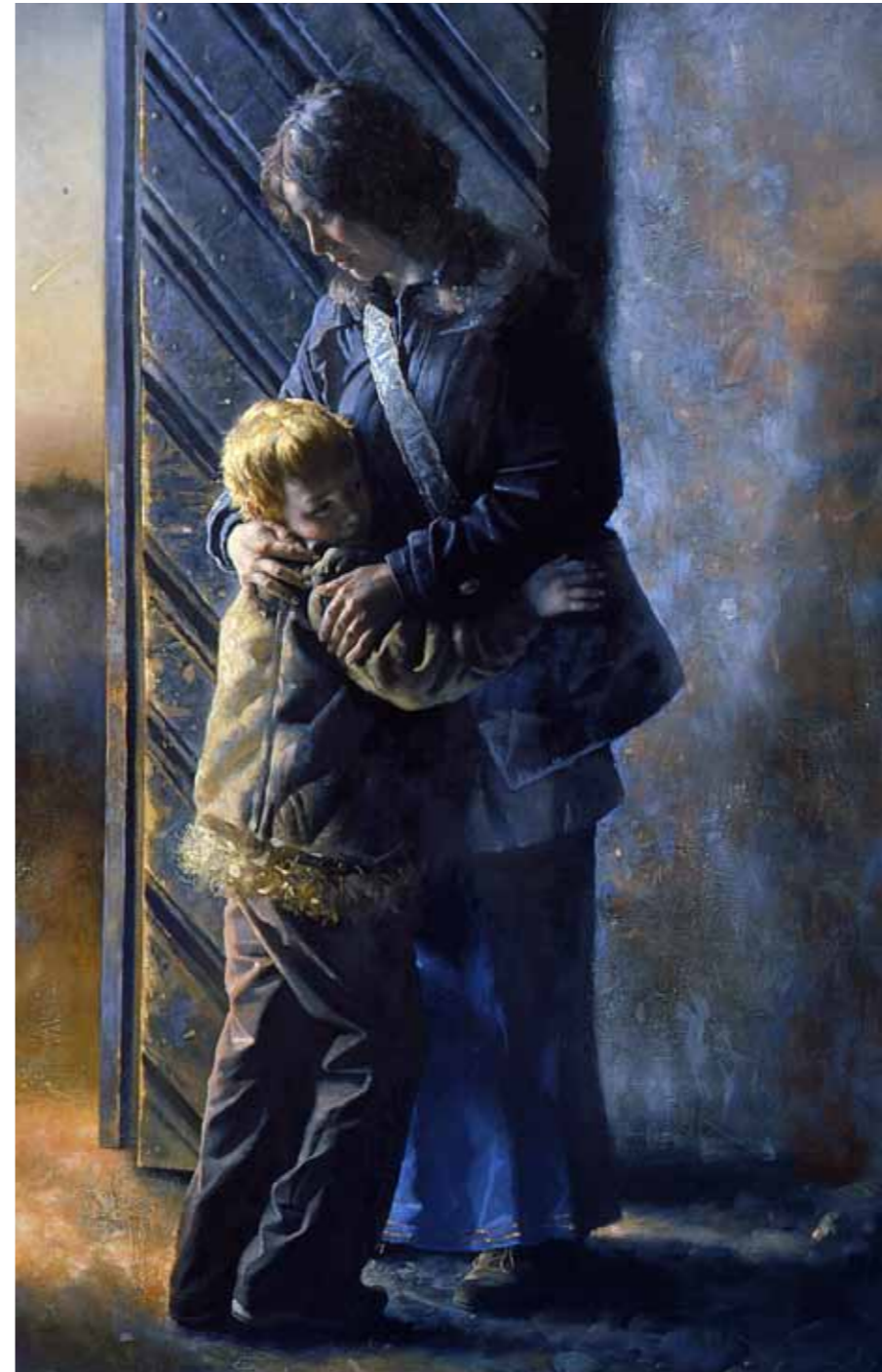
„Kadunud poja tagasitulek“ · 160 x 100 cm · lõuend, õli, 2009 a.

Näitusel on väljas maal „Kadunud poja tagasitulek“ aastast 2009.