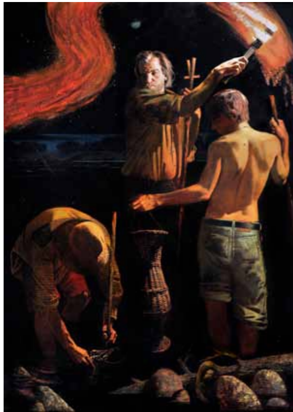
„Lapsepõlvest, vähipüük“ · 200 x 142 cm · lõuend, õli · 2009 a.

Esimene personaalnäitus toimus 2009. aastal Repini nimelise kunsti-, skulptuuri- ja arhitektuuriinstituudi Itaalia saalis. 2011. aastal näidati Ivanovi töid Pekingis toimunud näitusel „Repinlased“. Samal aastal osales ka Venemaa Kunstnike Liidu korraldatud näitusel „Kolm punkti“ ja tsentraalses näitusesaalis „Maneež“ aset leidnud näitusel „Geeniused ja šedöövrid“.