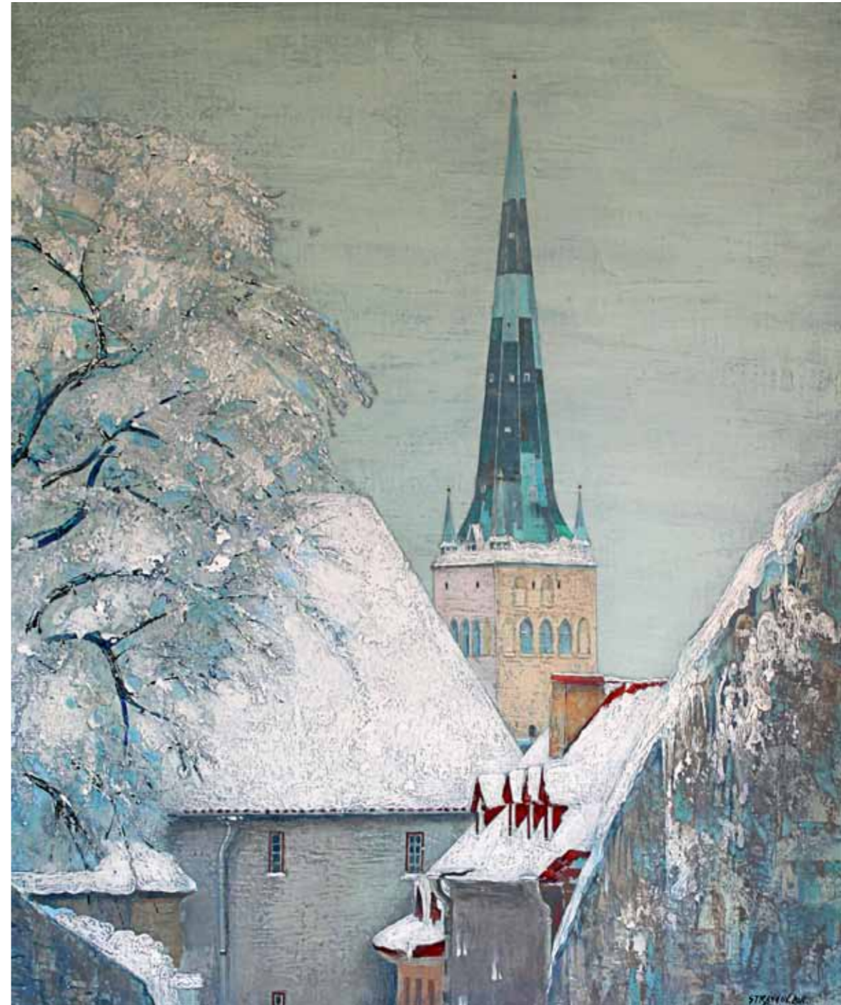
diptühhon „Tallinn“ · 60 x 50 cm · lõuend, õli · 2011 a.

Näitusel on väljas 2011. aastal loodud diptühhon „Tallinn“.