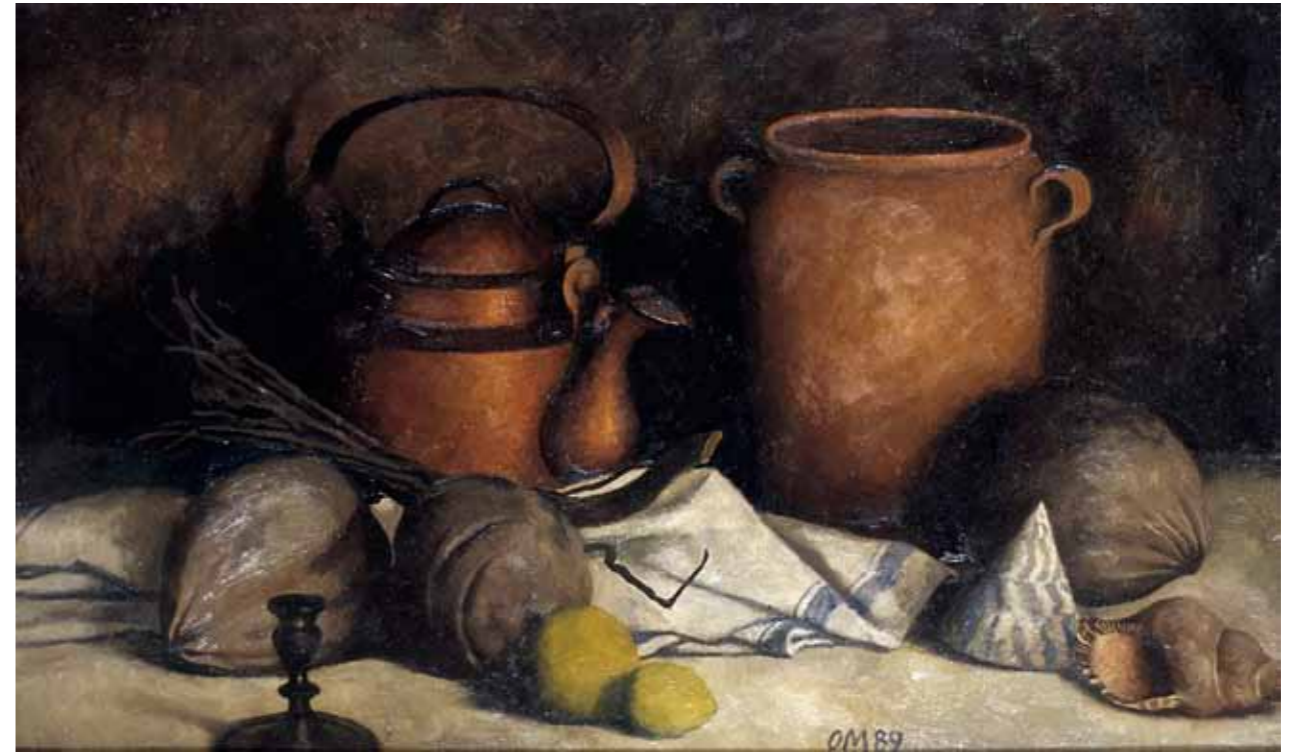
„Vaikelu kookospähklite ja merekarpidega“ · 62 x 104 cm · fibroliit, õli · 1989 a.

Näitusel on väljas Marani 1989. aastal tehtud töö „Vaikelu kookospähklite ja merekarpidega“.