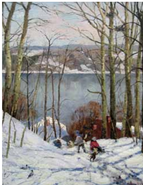
„Sära, märts, viimane päev“ · 90 x 70 cm, lõuend, õli · 2008 a.

Näitusel väljas olev töö „Talverõõmud“ on maalitud aastal 2011, „Sära, märts, viimane päev“ 2008. aastal ja „Serbino küla, Valerka mõis“ 1994. aastal.