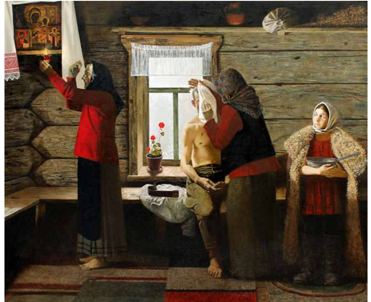
„Pesemine“ · 190 x 230 cm · lõuend, õli · 2012 a.

Ivanovi maal „Pesemine“ sellel näitusel on aastast 2012, teine töö „Lapsepõlvest, vähipüük“ on loodud aastal 2009.