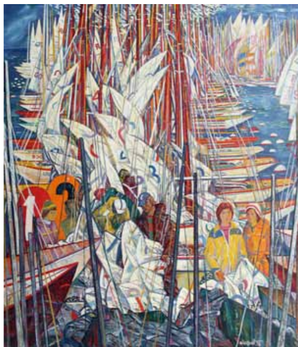
„Jahisadam“ · 155 x 180 cm · lõuend, õli · 1978 a.

1972. ja 1975. aastal sai auhinnaks diplomi noorte kunstnike näituselt Moskvast, aastal 2000 Eesti Kunstnike Liidu preemia. 1978. aastal sai pronksmedali NSVL rahvamajanduse saavutuste näitusel Moskvast, aastal 2001 Konrad Mäe medal.