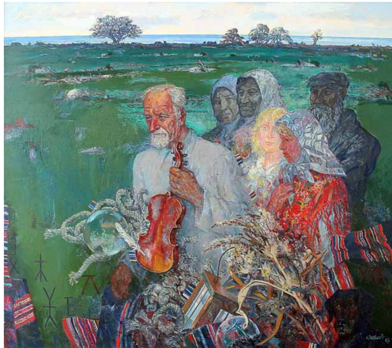
„Kihnu viis“ · 170 x 150 cm · lõuend, õli · 1985 a.

Näitusel võib näha Roosvalti töid „Kihnu viis“, loodud aastal 1985, ja „Jahisadam“ aastast 1978.