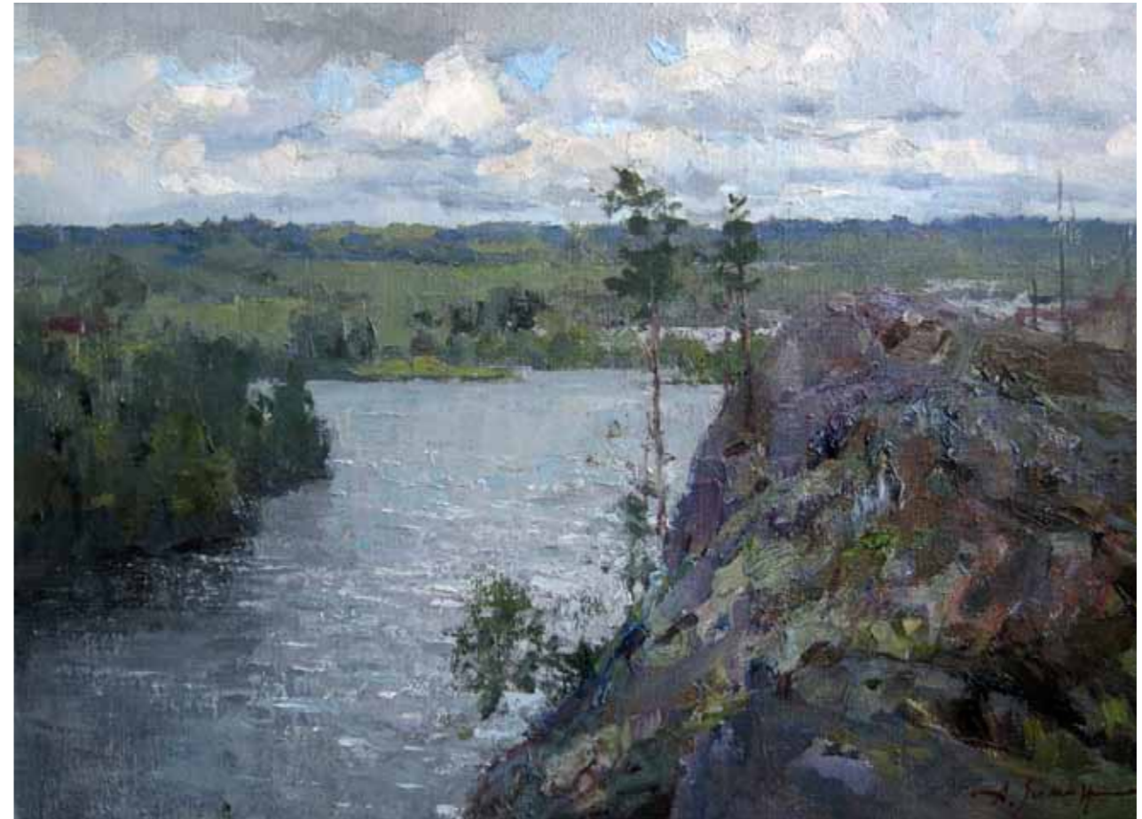
„Kotkamägi“ · 50 x 70 cm · lõuend, õli · 2011 a.

Näitusel saab näha kunstniku kolme tööd: „Kotkamägi“ (2011), „Suvi“ (2010) ja „Õhtu“ (2004).