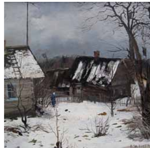
„Serbino küla, Valerka mõis“ · 42 x 42 cm · lõuend, õli · 1994 a.