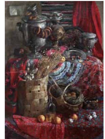
„Natüürmort samovariga“ · 150 x 100 cm lõuend, õli · 2010 a.