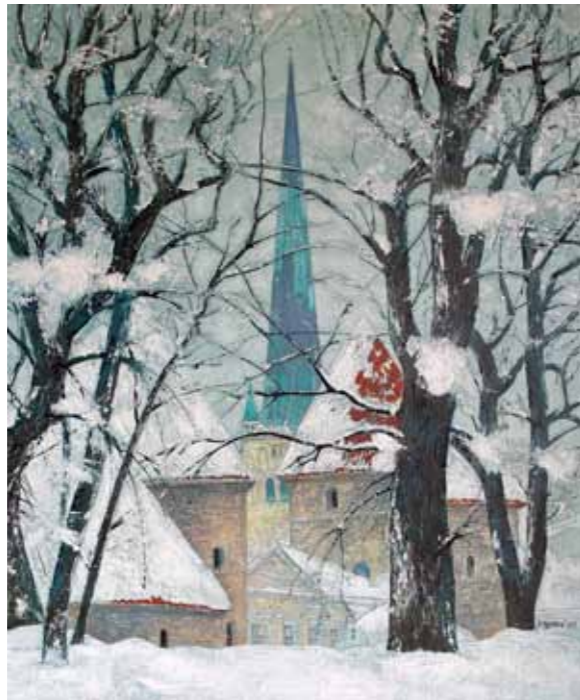
diptühhon „Tallinn“ · 60 x 50 cm · lõuend, õli · 2011 a.

Strahhovi looming sarnaneb rühmituse „Mir iskusstva“ esteetikale. Ta tungib kujutatava eseme olemusse, imetledes eseme faktuuri ja vormi, katsetades iga kord uue ja originaalse lähenemisega, tulla tagasi talle armsaksaanud kujundite juurde.