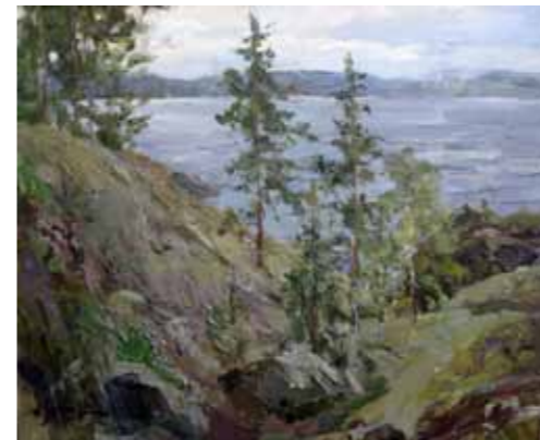
„Suvi“ · 50 x 62 cm · lõuend, õli · 2010 a.