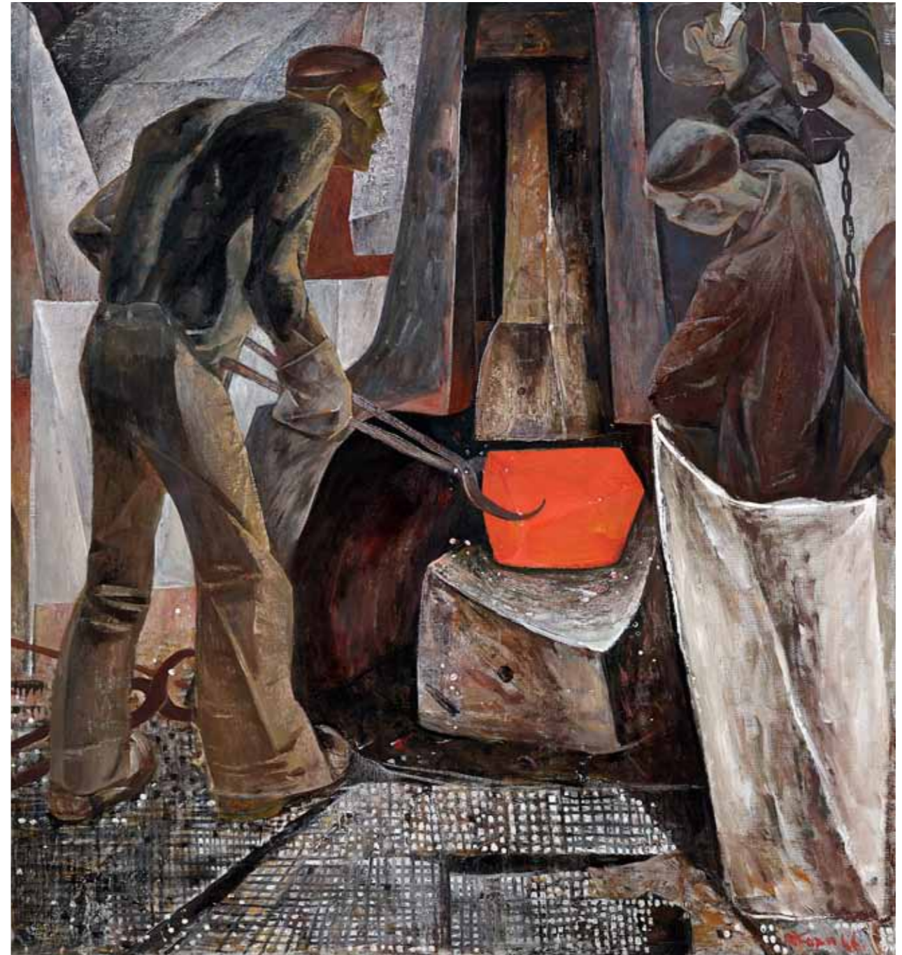
„Sepikoda“ · 144 x 131 cm · lõuend, õli · 1966 a.

Näitusel saab näha tööd „Sepikoda“, mis on loodud aastal 1966.