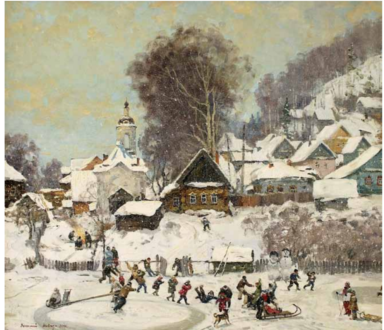
„Talverõõmud“ · 10 x 120 cm · lõuend, õli · 2011 a.