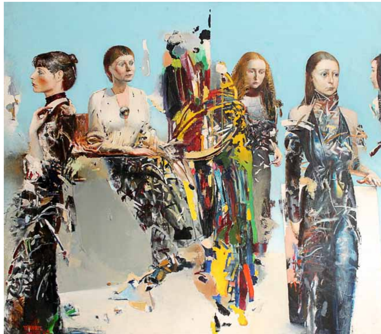
„Neli naist ja värvid“ · 150 x 170 cm · lõuend, õli · 1981 a.

Näitusel näeb Päsukese tööd „Neli naist ja värvid“, mis on loodud 1981. aastal.