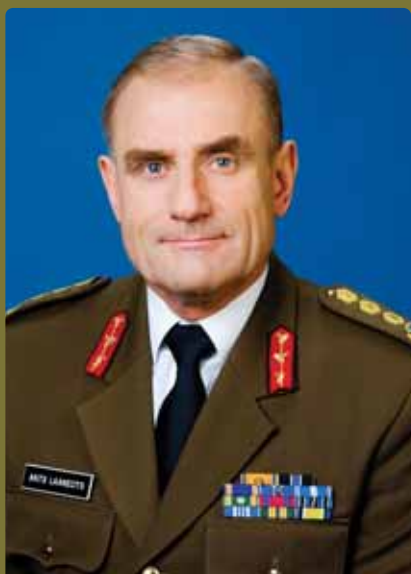
Генерал-лейтенант Антс Лаанеотс , Руководитель Вооруженных сил

С военной точки зрения – у НАТО нет в мире противников