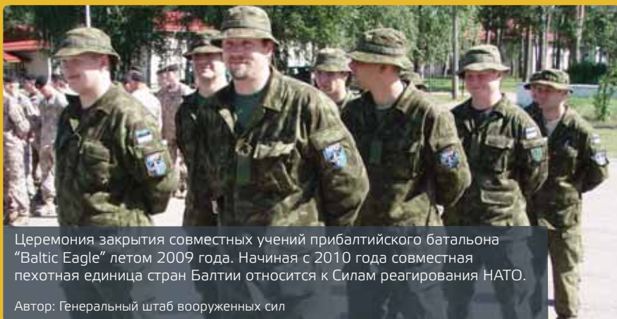
Церемония закрытия совместных учений прибалтийского батальона "Baltic Eagle" летом 2009 года. Начиная с 2010 года совместная пехотная единица стран Балтии относится к Силам реагирования НАТО.

Подробнее об операциях на веб-сайте: operatsioonid.kmin.ee