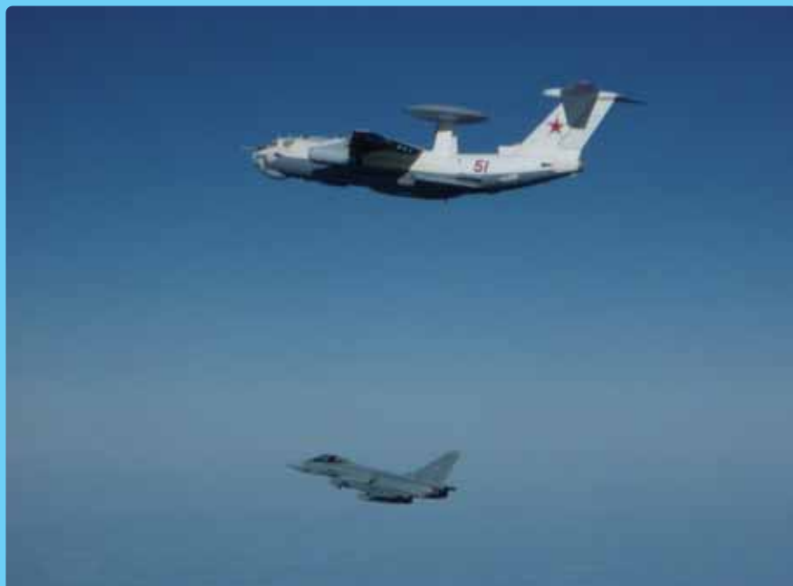
Будни воздушных оборонительных операций НАТО: Немецкий истребитель "Eurofighter 15" преследует летчика русской разведки вблизи воздушного пространства Эстонии.

Самым важным принципом и опорой НАТО является принцип коллективной защиты, т.е. статья 5 Североатлантического договора. Принцип, согласно которому военное нападение на одну страну-члена является нападением против всех стран-членов, является основным инструментом сдерживания всех потенциальных агрессоров, угрожающих безопасности стран-членов НАТО. К настоящему времени устрашение НАТО успешно длится уже более 60 лет.