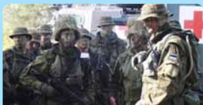
В 2006 году в Эстонии прошли совместные военные учения Эстонии и Великобритании "Kalev Express".