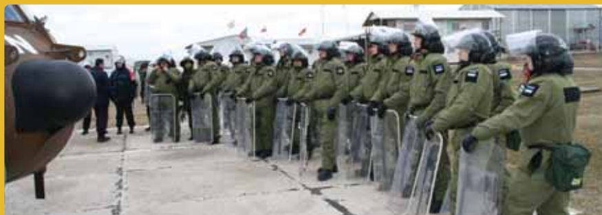
Служащие Вооруженных сил Эстонии в Косово на учениях по подавлению массовых волнений в 2006 году.

В связи со значительным улучшением ситуации с безопасностью министры обороны НАТО приняли решение постепенно уменьшать присутствие НАТО. В 2010 году вклад Эстонии ограничится лишь офицерами штаба в штаб-квартире KFOR.