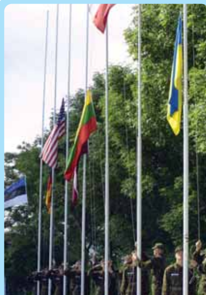
Открытие учений "Sarex-Divex" в 2004 году.