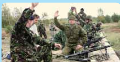
На учениях "Kalev Express" практиковалось сотрудничество.