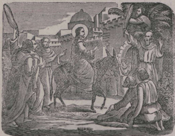
Jeesus lähleb Jeruusalemma.