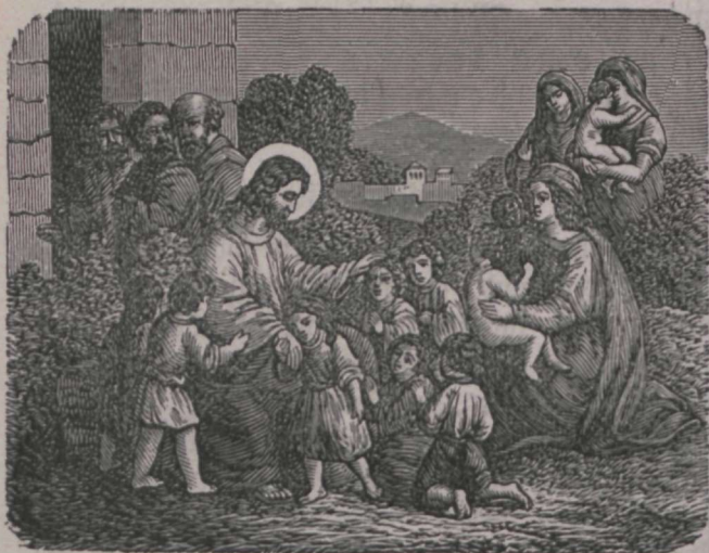
Jeesus õnnistab lapsukesti.

Rõige pealt olen mina teid püüdnud juhatada Jumala juurde. Ma olen jelle suure koolmeistri sõnu meeles pidanud, kes ütles: Laste need lapsukesed minu juurde tulla ja ärge keelge neid mitte! Jumala