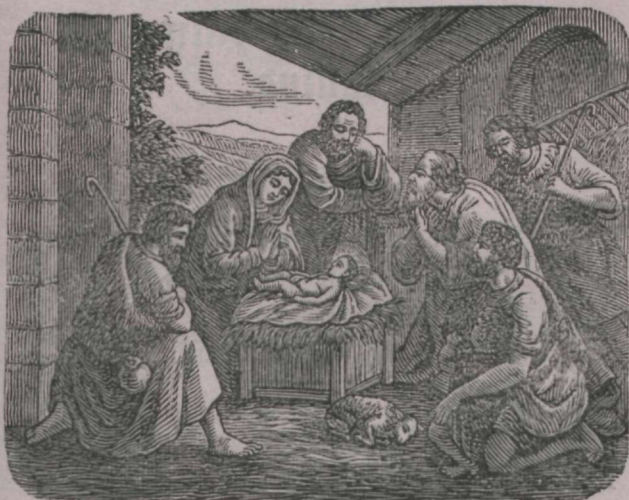
Jeesuse Kristuse sündimine.