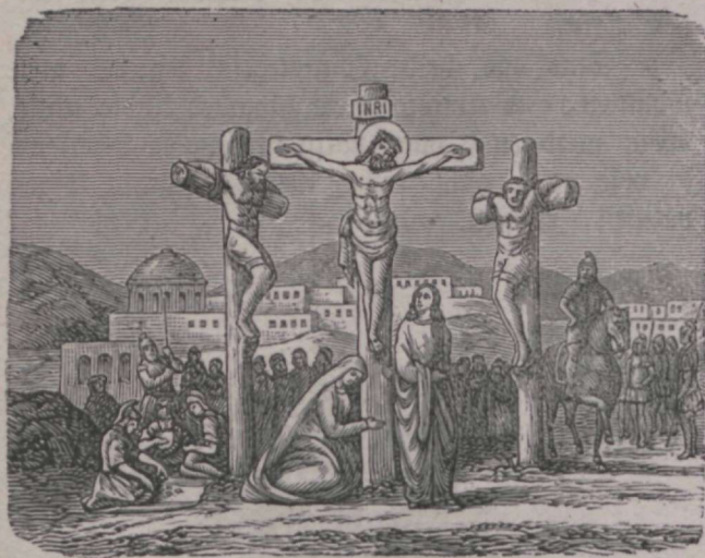
Jeefuse Kristuse ristilõõmine.