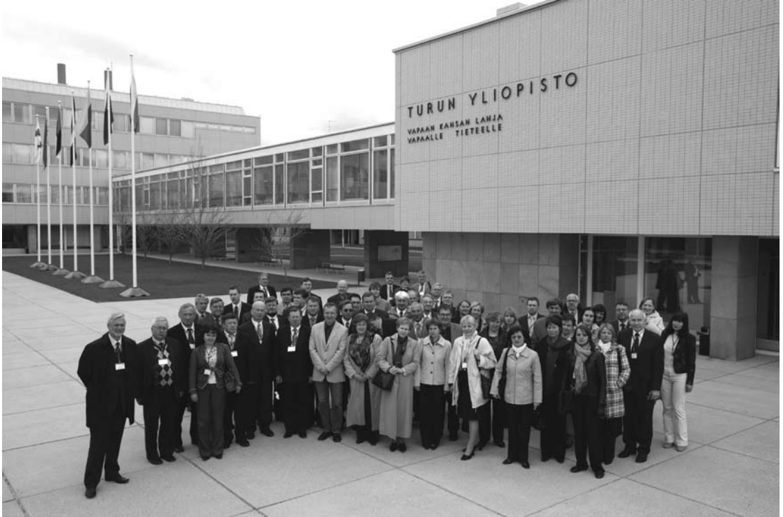
BSRUN:n konferenssin osanottajat Turun yliopiston päärakennuksen edessä 2007.