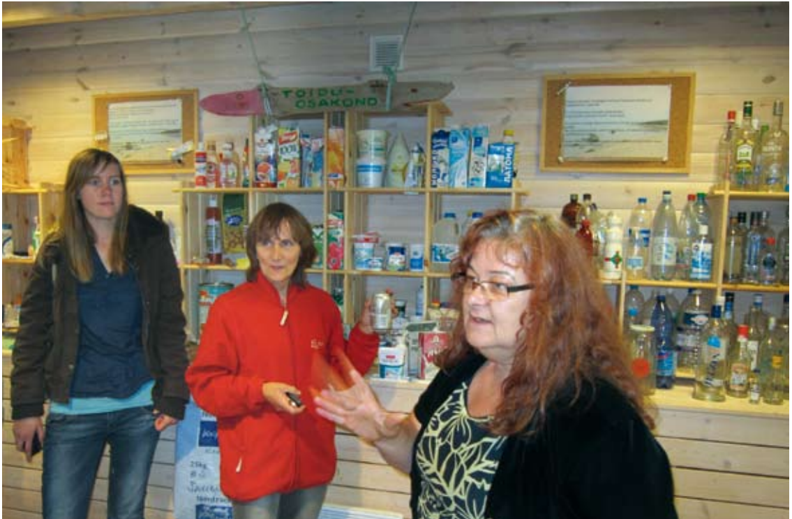
Quadruple -hankkeen opintomatalla Hiidenmaan Merekaubamajassa 2011.