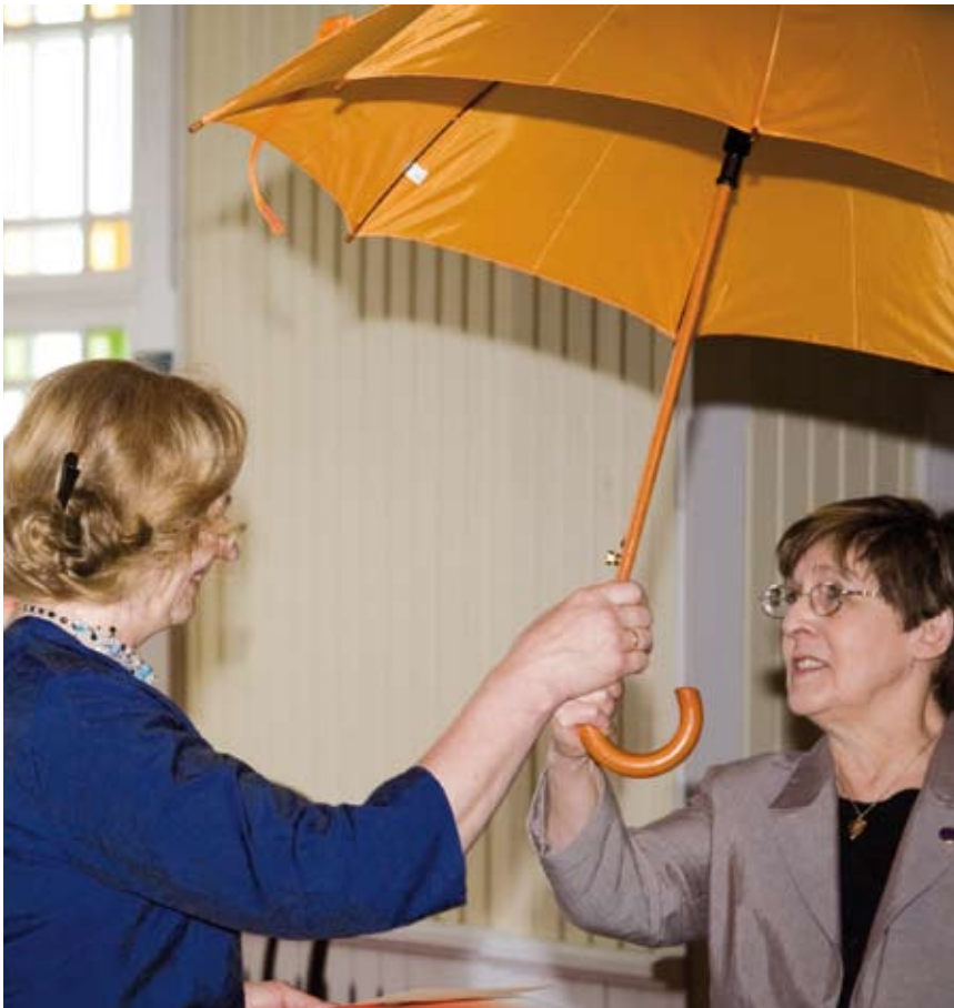
Ikäntyvien yliopiston opiskelijat menossa Kuussaaren Kuursaliin loppujuhlaan 12.04.2012.