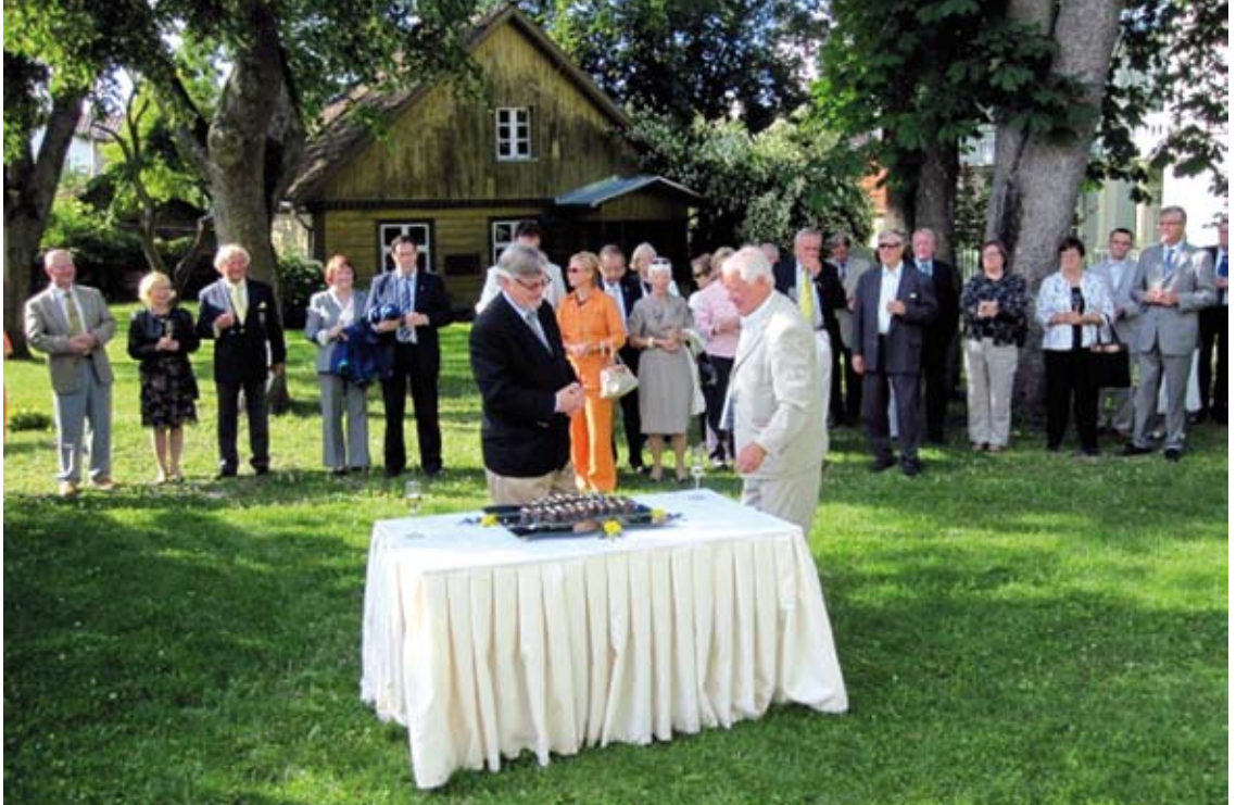
Turun Yliopistosäätiön vastaanotto yliopistokeskuksen pihalla entisille ja nykyisille luottamushenkilöilleen heinäkuussa 2011 Itämeren Historia -seminaarin yhteydessä.