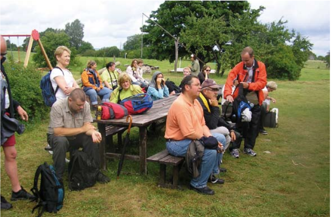
Tarton Yliopiston kansainvälisen kesäyliopiston osanottajat Abruukan saarella 2008.