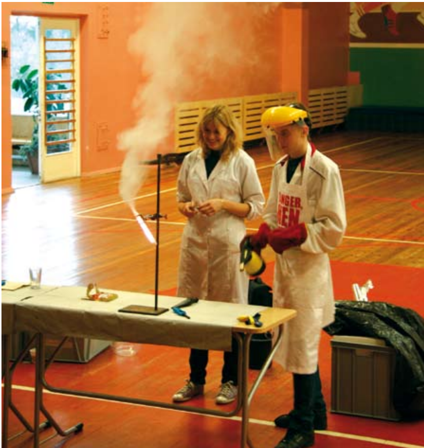
Tartn Yliopiston tiedeteatterin esitys Kihelkonn koulussa 30.11.2011.