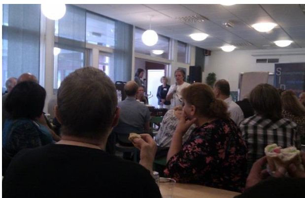
Диалог с методом открытого пространства в Форнхёиден 29.08.2013

Мероприятие ставило перед собой целью привлечь всех жителей района Форнхёиден - всех возрастов, разного происхождения и профессий. Сотрудники местного муниципалитета (из начальной школы, молодежного центра), сотрудники НПО из объединения жильцов, и местного лютеранского прихода активно распространяли приглашения. Местные СМИ и муниципальные СМИ распространяли информацию о мероприятии за месяц до его проведения.