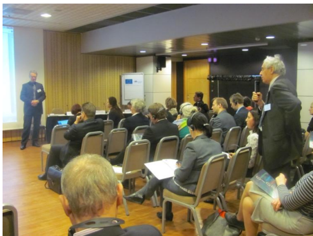
Форум диалога в Таллинне 15-16.04.2013

На Таллиннской конференции состоялось пленарное заседание в начале конференции – на котором были представлены цели проекта и результаты сравнительного анализа, проведенного в ходе осуществления проекта. На заключительном пленарном заседании были представлены результаты обсуждений двух «аквариумов». В программу заключительного пленума также была включена презентация основных принципов иммиграционной политики Эстонии. Однако модератор конференции в комментариях и предложениях по поводу конференции отметил, что такой обзор был бы куда полезнее, будь он представлен еще до проведения «аквариумов». Также было высказано предположение, что участники могли бы извлечь пользу из вступительной презентации о русскоязычном образовании в Эстонии, если бы она была представлена во время пленарного открытия. Это позволило бы всем участникам на равных принять участие в дискуссии в ходе семинаров. На заключительном пленарном заседании участникам было предложено выразить свои пожелания в области дальнейших действий по улучшению ситуации в двух обсуждаемых сферах жизни (на рынке труда и в образовании). Эти предложения были сформулированы и занесены в короткие протоколы (объемом 2-3 страницы) конференции и направлены соответствующим специалистом, формулирующим политические решения.