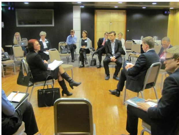
Аквариум о иностранной рабочей силы в Таллинне 15.04.2013

Участники были разделены на два «аквариума» - (i) обсуждение необходимости привлечения иностранной рабочей силы в Эстонию – потребуется ли вносить изменения в нормативные акты, касающиеся привлечения иностранной рабочей силы в Эстонию, и приведет ли такое привлечение к возникновению проблем для Эстонии, и (ii) будущая модель русскоязычного основного образования в Эстонии, которое обеспечит участие всех членов общества на рынке труда, при одновременном предоставлении возможностей сохранения этнической и культурной идентичности.