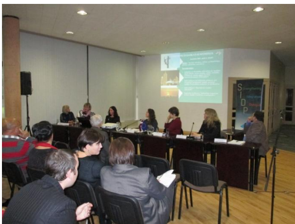
Конференция в Риге 26-27.09.2013

Участие приняли также журналисты и студенты. Важно отметить, что на конференции было два рабочих языка (латышский и синхронный перевод на английский язык). Хотя синхронный перевод на русский язык не был обеспечен (по финансовым причинам), участникам была предоставлена возможность задавать вопросы, в том числе, и на русском языке. Это дало участникам возможность выбора наиболее комфортного для самовыражения языка.