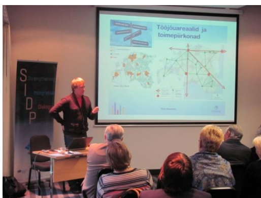
Учебный семинар о диалоге в Нарва-Йыэсуу 22.11.2013

По возможности было бы хорошо организовать учебный семинар на предполагаемую к обсуждению тему для участников, или пригласить внешних экспертов для подготовки заключения по данному вопросу. Этот подход подготовки участников чаще всего используется в случае техники диалога «Конференция» - см. подраздел 3.1.