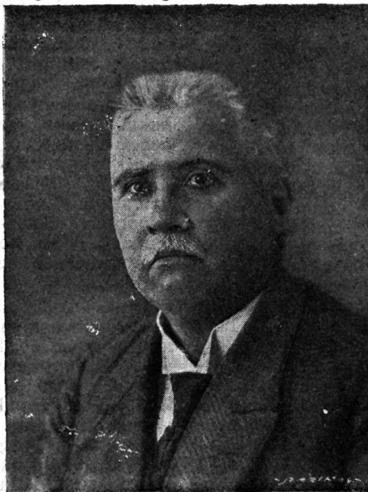
Riigivanem Jaan Teemant.