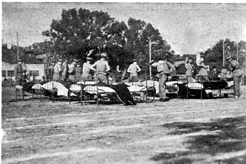
Politsei alarm- jooksu start.