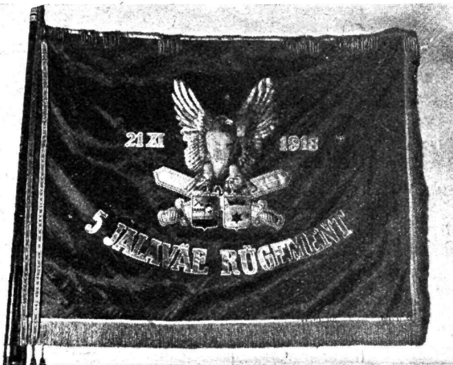
Rakvere 5. üksikule jal. pataljonile Rakvere linna ja Virumaa rahva poolt (25 XI 1928) annetatud lipp.

sed teened polgu vormeerimisele ja varustamisele kaasaaitamises.