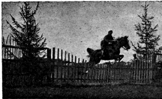
Hüpe üle tundmata takistuse.