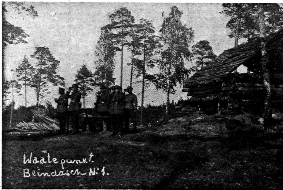
Waatepunkt Blindaash N:1.

Kahurwõe II grupi suwised õppused laagris.