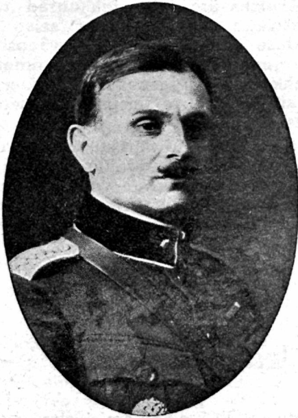
Kindralstaabi kindral-majoor J. Soots, Wabaduse Risti 1. liigi 1. järgu kawaler.

Jaan Soots , sündinud 12 märts. 1880 Helmes, Wiljandimaal Eelhariduse saanud õpetajate seminaris Riias. Wilno sõjakooli 1904 a. 1. järgu diplomaadiga lõpetanud ja alamleitnandiks ühendatud. 1905 a. Wene-Jaapani sõjast osa võtnud. Nikolai sõjaväe akadeemia 1913 a. 1. järgu diplomaadiga lõpetanud. Ilmasõda tabas teda kompanii ülemana, mille järele ta 16 korpuse käskude täitjaks kindralstaabi ohvitseriks määrati, kus ta mitmel ajal tegew oli ja talle mitmed wastutusrikkad ülesanded anti. 1916 a. kewadel, kui Brussilow pääletungimist algas, lahkus kapten Soots 16. korpuse staabist, et nende diwiiside ja brigaadide staapideks teenida, kes nimetatud pääletungist osa võtsid. 1916 a. sügisel ühendati kapten Soots alampolkownikuks ja määrati XI armee staabi juure käskude täitjaks ohvitseriks. 1917 a. jaan. määrati ta nimetatud staabi alla kuuluwate õhujõudude käskude täitjaks ohvitseriks. Sama aasta kewadel lõpetas alampolkownik Soots Kiiewis lendur-waitlejate kooli. Mais 1917 komandeeritakse ta ülemjuhataja telgi juure.