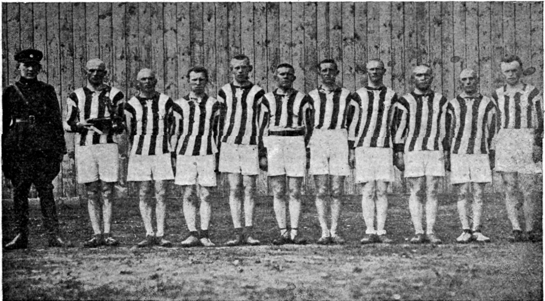
Wõitja — 10. jalgwäe rügemendi meeskond.

majandusliste päewakäskude ärakaotamine jne.), kuid on weel mõndagi, mis järjekorda ootab. Ei saa siin märkimata jätta, et keskasutused wäeosade asjaajamise lihtsustamise küsimustele seni õige wastutulematud on olnud, olugi, et nende kohus oleks selle läbiwiimiseks kõik teha. Tõenduseks tuletan meele majandusliste päewakäskude ärakaotamise loo, mis, hoolimata sellest, et ta wäeosade poolt rõhuwa enamusega tarwilikuks tunnistati, mõne keskasutuse poolt omal ajal wälja naerdi; alles kuni tüütuseni pääiekäimiste järele lahenes asi wiimaks jaatawalt.