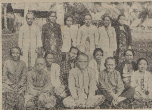
Korea naised Päästearmee varjupaigas.

Varsti pärast seda, kui Päästearmee lipp hakkas lehvima Koreas, püüdis ohvitserid suurte jõupingutustega võita pärismaalasi usule Jeesusesse