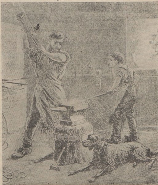
Sepa koer magas rahulikult alasi kõrval.

Mu armsad, armastagem üksteist, sest armastus on Jumalast,