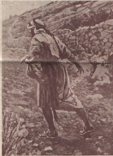
Külv, mida kord lõigatakse.