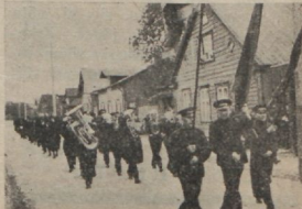
Paremal: Vabaõhu rongikäik Tallinnas.