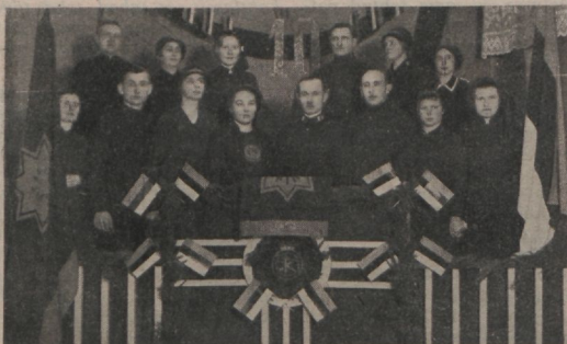
Tartu korpuse seltsilisi. (Vaata kirjutist 7. lhk.)