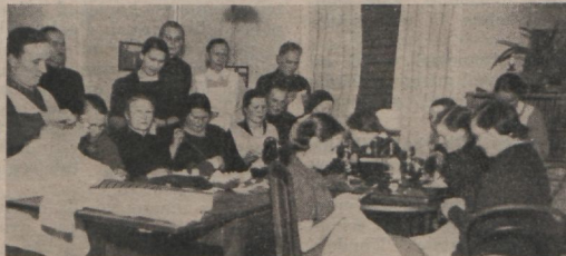
„Talgulised“ tüöl. (Vaata kirjeldus 7. lhek)

õpetaja rääkis temaga ja vastas, umbes järgmiselt: „Jumal on tegutsenud minuga karmilt, sest minu siht abiellumise temaga, oli võita teda Jumalale.“ Kõik inimesed, kes tundsid tol ajal noort naist, teadsid, et ta mõttes kõige vähem sellele, kuidas võita oma mees Jumalale. Ent kui tema suur viha sai avalikuks, rääkis ta nii oma õpetajale. Sõnakulmatusele Jumala vastu ja heade sõprade nõuande põlgamisele andis ta nüüd ilusa nime: eneseohvrime. Oma enese süü eest ta tahtis nüüd süüdistada Jumalat, selle asemel et võtta vastutus endale. See on väide sellest, kuidas meie inimesed mängivad iseenesega peitust ja annavad ilusaid nimesid sõnakulmatusele Jumala vastu.