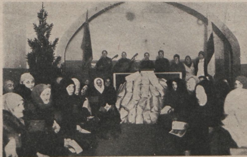
Vaeste jõulupuu Tallinnas.

29. detsembril aga kihvas Päästearmee lastest. Keegi ei suudaks arvata seda rõõmu ja kilkamist, mis oli siis. Võime ainult arvata, milline tunne võib täita lapsi, kes kohtavad midagi erakordset. Nad võisid mängida, juua teed ja mõned neist võisid esimeda deklamatsiooni või lauluga. Nad ei jäänud ka ilma suuremast üllatusest — jõuluvanast, kes jagas neile pakid, kuhu olid pandud maiustused ja päästesõdurite poolt valmistatud riided.