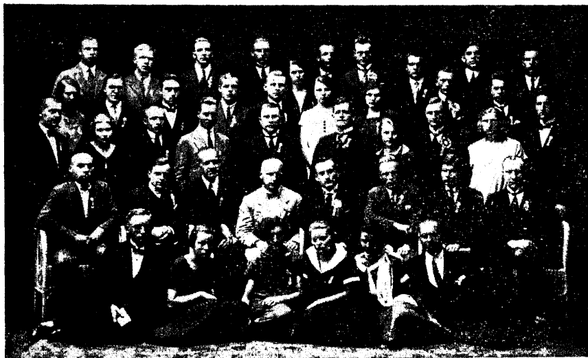
III üleilmisest üliõpilaste karskuskongressist osavõtjaid Tartus, suvel 1926 (puuduvad pooled).