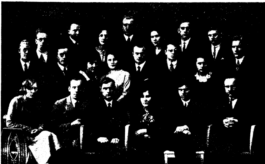
EÜKÜ ametnikke II sem. 1930 (puudub 5).

vusülesandele leidis välistegevuse alagi viljelemist. Nii võeti osa Soome hõimupäevadest Turus 7 esindajaga, kus tihendati sõprusvahekorda Soome üliõpilaskarskusühendusega. Ka tehti käesoleval semestril algust kõnelejate reservi moodustamisega oma liikmeskonnas, et oleks tarbekorral võimalik saata kõnelejaid nii noorsoo kui ka täiskasvanute karskus-