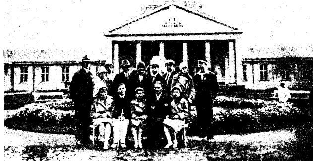
EÜKÜ II suvipäevast osavõtjaid Pärnus 1929.

Suur elutung, rohke energia ülejääk, osalt ka romantikahiha, kalutavad noort siin ja paljudel puhkudel ta lihtsalt kukub ümbruskonda, mis neelab vägisi ta karskusmeelsuse. Meil tuleb vaadata enne kõike üliõpilaskonna ja seda moodustava organisatsioonide hulga üldist palet, eriti alkoholismi suhtes. Pole mingit kahtlust: alkoholism meie üliõpilaskonnas on väga levinud, etendades selle siseelusmääratamata. Võetagu vaid arvesse seda alkohoolikute hulka, mis mitmes üliõpilaskonnas organisatsioonil igal semestril