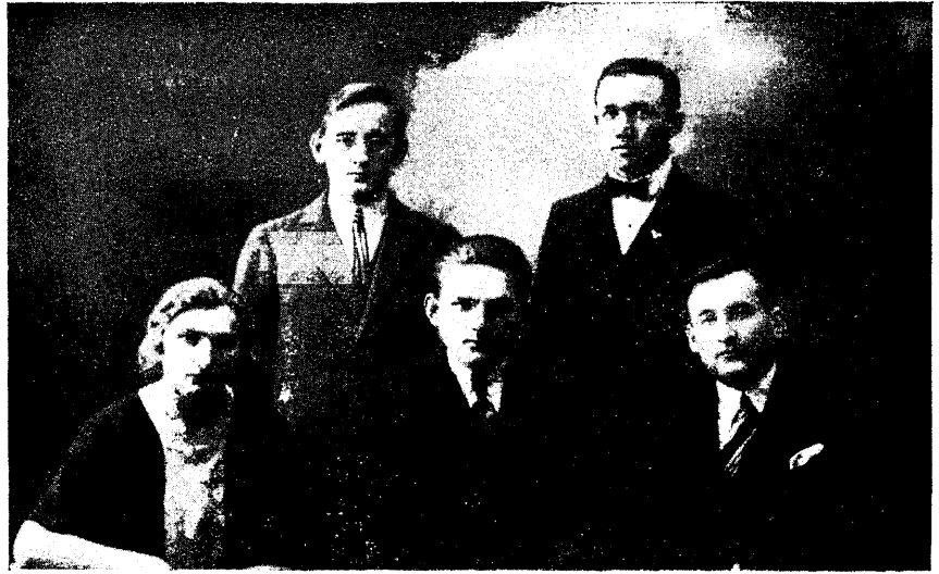
EÜKÜ praeguse organisatsioonitüübi I juhatus 1924/25.

kondate üliõpilasist (int. el.) ja ka ülikooli lõpetanuist (ak. el.), ning liikmete vastuvõtmisel kaalutakse nende vastavust org.-i kodukorra erilistele nõuetele (täiskarskusmõistele kitsamas ning laiemas mõttes) ja nende suhtumist karskustööle, rõhku pannes nii siis liikmeskonna kvaliteedile (osaline int. el.). Väike liikmemaks, (mis on võimalik ainult Karskusliidu poolt toetusena tasuta antud ruumide tõttu).