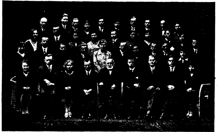
EÜKÜ liikmeid 9. aastapäeval nov. 1929.

1 näiteks on karskustoimkond olemas Akadeemilises Põllumajanduse Seltsis.