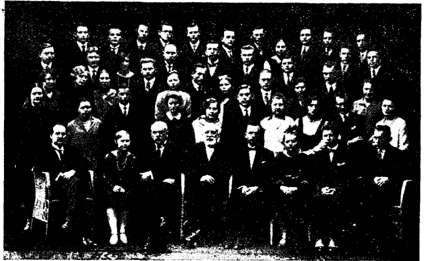
EÜKÜ liikmeid 8. aastapäeval nov. 1928 (puuduvad pooled).

Ülal oli riivatud, ja ainult riivatud üksikuid mõtteid, momente, vabalt, nii kui need sisendusid