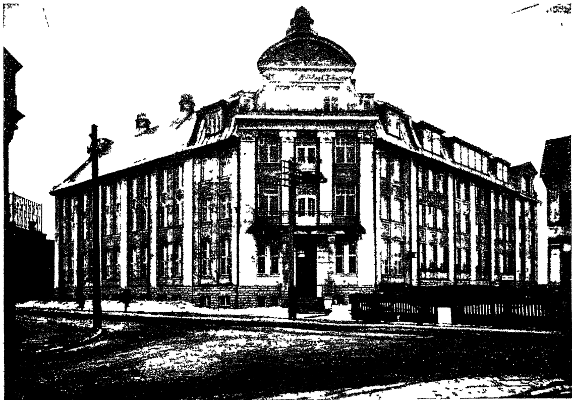
Uus „Merimeeste Kodu“ hoone Tallinnas.

SISU: Tööstusmaks valdade heaks loojõu pikkumise ja loojõu nõudmise vahetõrge Festis Nõukogude Vene rahakrisis Veel kodukasitöö osakonnast naitus-messil Eesti tule- ja hüpetekindel sävi Kaupmeeste organisatsioonidest Kaubandus-tööstuskoja teated Türiste riikide majanduslik elu-olu Teateid kodu ja välistraat Turgude ülevaade Tõlhitteateid Toiduainete turg Borsi kursid