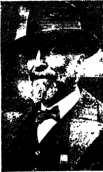
Montagu Norman, üks tähtsamatest rahaasjanduse tegelastest Inglismaal, kes seitsmendat korda valiti Inglise panga kuberneriks.

Seemnekasvatuse on niihästi kuivas, soojas ja mustamulla lõunapoolses osas kui ka külmal, liivasel maal mere ligidal. Talve-teravilja ja rukist võib ainult niisugustesse riikidesse ekspordeerida, kuhu neid viiakse Poola lõikuse ja im-