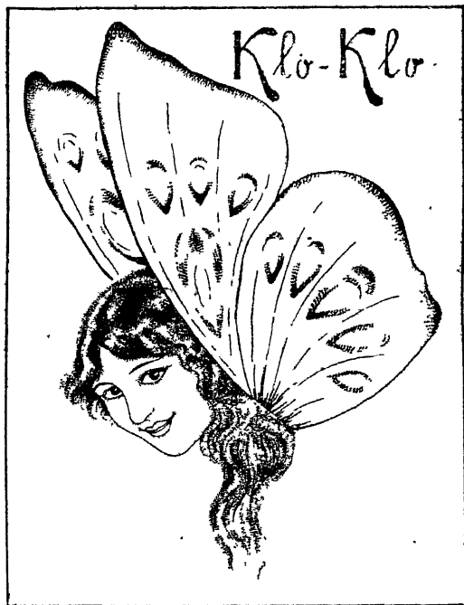
A.-S. „Laferme“ viimane kevadine uudis: paberossid

Kaubanduses oli märtsis märgata hindade uut kerkimist. Väikekaubanduses oli eriti linnades elav tegevus, kus mõnesuguste ainete kaupluste ees järjekorrad ootajate sabad tekkisid. Põhjuseks võisid siin olla esiteks kaupade puudus ja siis kuuldused vabrikute seismajäämistest tooresainete puudusel, mille järeldusena suuremat kaubahindade tõusu kardetakse. Suurmüügi äridest — riiklikud kauband. ettevõtted — olid paljud sunnitud kaupade puudusel uksi sulgema. Üldiselt töötavad riiklikud kauband. ettevõtted suuremalt osalt puudujäägiga. Erakaupmees — väikekaupmees — on tegevust märksa paremini