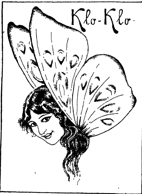
A.-S. „Laferme“ viimane kevadine uudis: paberossid

Kui praegusel ajal imetleme vanaaegseid käsitöid, ei pane imestama vana käsitöö tehniline läbiviimine seevõrra kui selle kunstiline väärus, rafineeritud maitserikkus ja ilu; tehnilist läbiviimist võimaldavad masinad ja uueaja leidused imestamisväärselt hästi, paremini igatahes kui käsitöö abil võimalik. Tööde jaoks, mida võib masin teha, peab käsitööline olema liig hea; ta peab masina võimalikult suurel määral ära kasutama toorestöö jaoks, sealt aga ise edasi viilima. Käsitöö siht olgu — mingit shabloonitööd, vaid