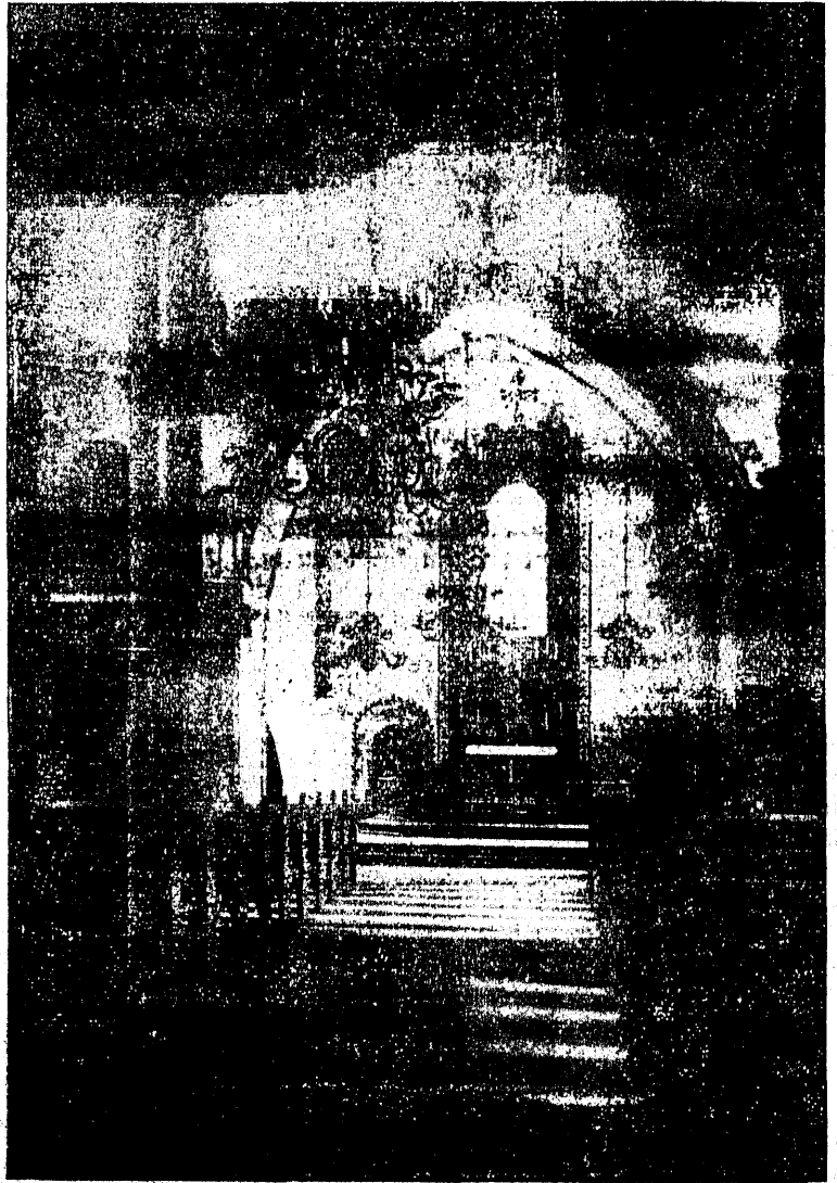
Laiuse kiriku siseruum.