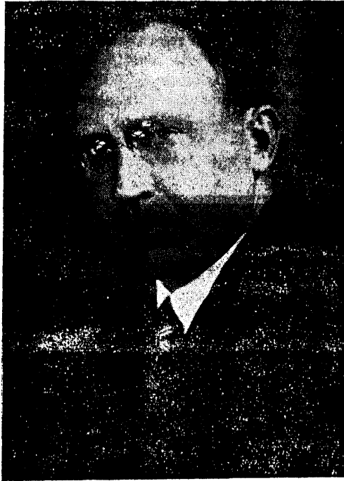
Op. mag. J. Järve alates 1923. a.

Pühap. 14. aug. oli Laiuse X laulupäev ühes rahvuspäevaga. Päev algas pihitijumalateenistusega kirikus, millele järgnes kontsertjumalateenistus kirikus.