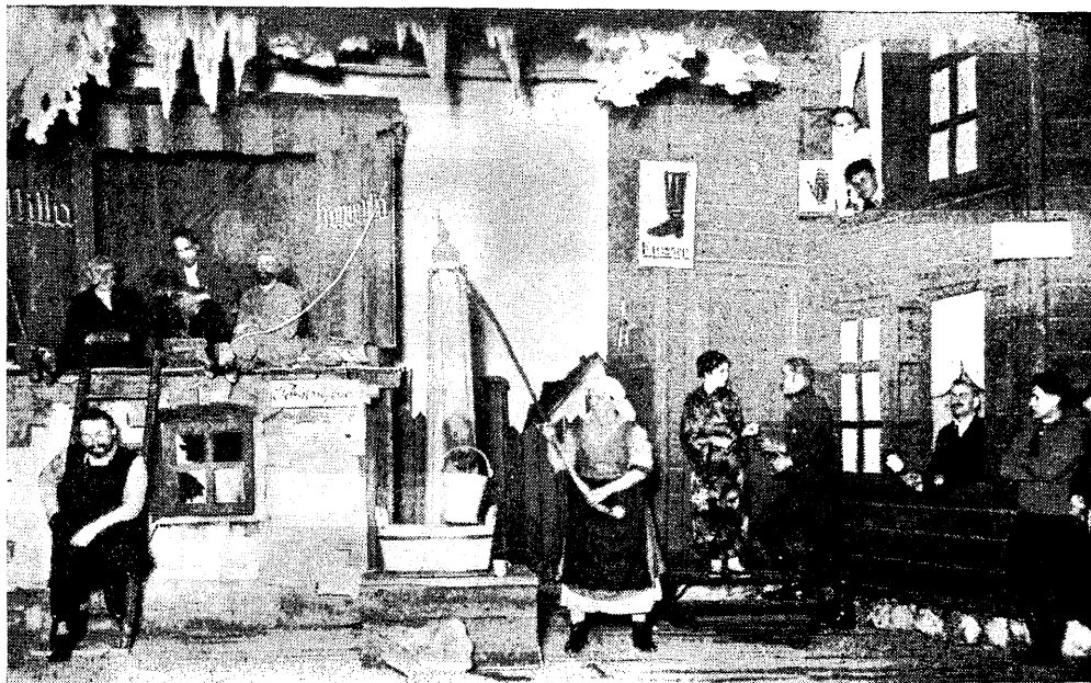
„Tagahoovis“ Tõrva V.T.Ü. lavakunsti kursusel.

Hea ja hoolsa mängu juures muutuvad mitmed „tühised“ mängud nautimisväärsesks.