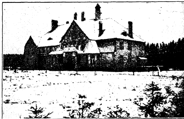
Holdre rahvamaja, Valgamaal.

Siinkaasas kerkib üles ka mõte kohtadel asutada kodukoha muuseume, kuhu tuleks koondada ja kus säilitada korraldatult materjale, mis võiksid iseloomustada kohaliku kultuurielu arengut. See on aga omaette probleem, mis väärrib lähemat iseseisvat käsitletu.