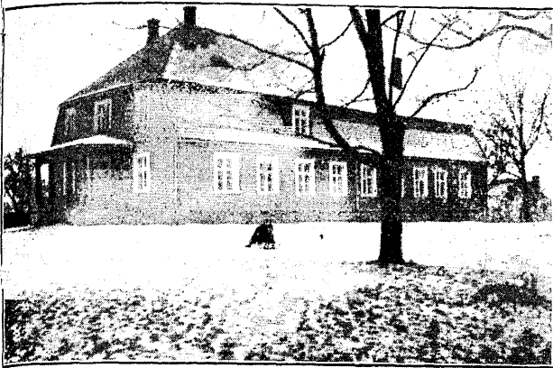
Sooru rahvamaja, Valgamaal.

On aga alasid, küsimusi ja võimalusi, mis eriliselt kuuluvad kodukoha kultuuriküsimuste ringi ja sellistena vajavad tähelepanu seltside tegevuskavas.