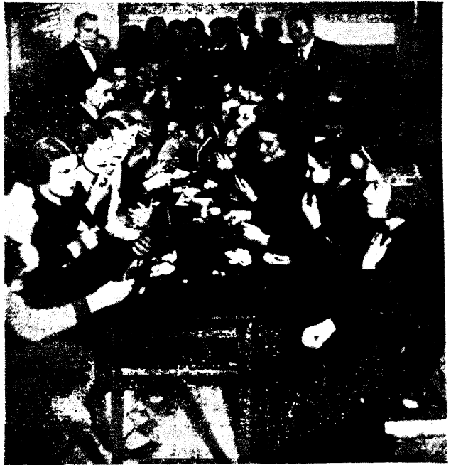
Ülal: kursusest osavõtjad.