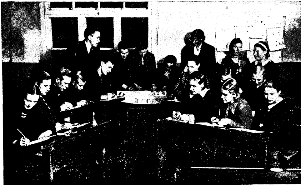
Adiste-Miiste Noorte Maatulundus klubi seinajalehte toimetamas.

ära õpetuseks ja hoiatuseks kõigile maateatri tegelasile üldiselt ja juhtidele eriti.