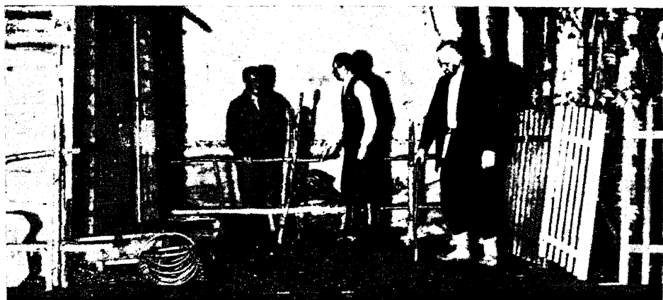
«Andres ja Pearu» Pala näitekursusel.

kohapeal jutustused „Issanda kiituseks“, „Marjad silmas“ j. t., mille-des tuntud ühes kui teises seigas kohalike olusid. Ka „Rahva valgustaja“ idee on valminud Põltsamaal ja selle tegelasile võivat tegelikult leida vasteid siin-seist ja Pilstvere vastavaist tegelasist.