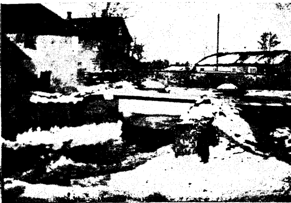
Põltsamaa jõeharu sillaga.

kamise hälli lähemas ümbruses tihti jäänud vaim mõnetigi tuimaks või vähimasti domineeriva majandusliku ja tehnilise elupoole varju?! — Millega näiteks seletada seda, et loengu puhul maaoludes eeskujulikumas rahvamajas haigutab tühjus, ajal, mil näiteks halvustatud Petserimaalgi ja kehva-võitu Saaremaal viletsavõitu ruumid ei suuda mahutada küllalt hästi kõiki kuulajaid? Või, millega seletada seda, et jõukas vald Põltsamaa külje all — esimese eesti suurema kooli läheduses — ei oma ühtki vähegi korralikku koolimaja, kuna vallaisad ei ole koolimaja-küsimust pidanud kuigi tähtsaks?!