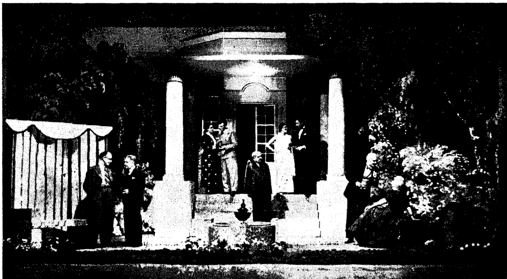
Aiastseen „Justiinast“ Töölisteatris.

ees hästi hoitud aed. Keskel purskkaev, vasemal ja paremal nurgas lehtlad pinkidega.