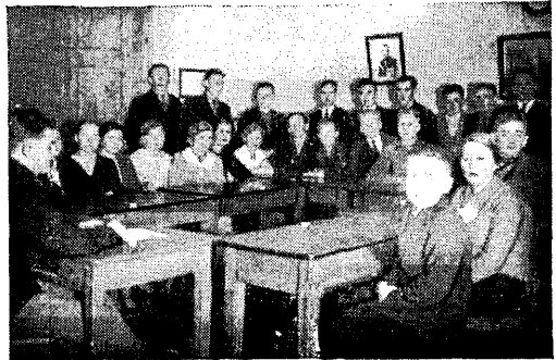
Neeruti õpiring Tartumaal.

Õpiring on tegutsenud suures osas loenguringina, kusjuures ettekannetega on esi-