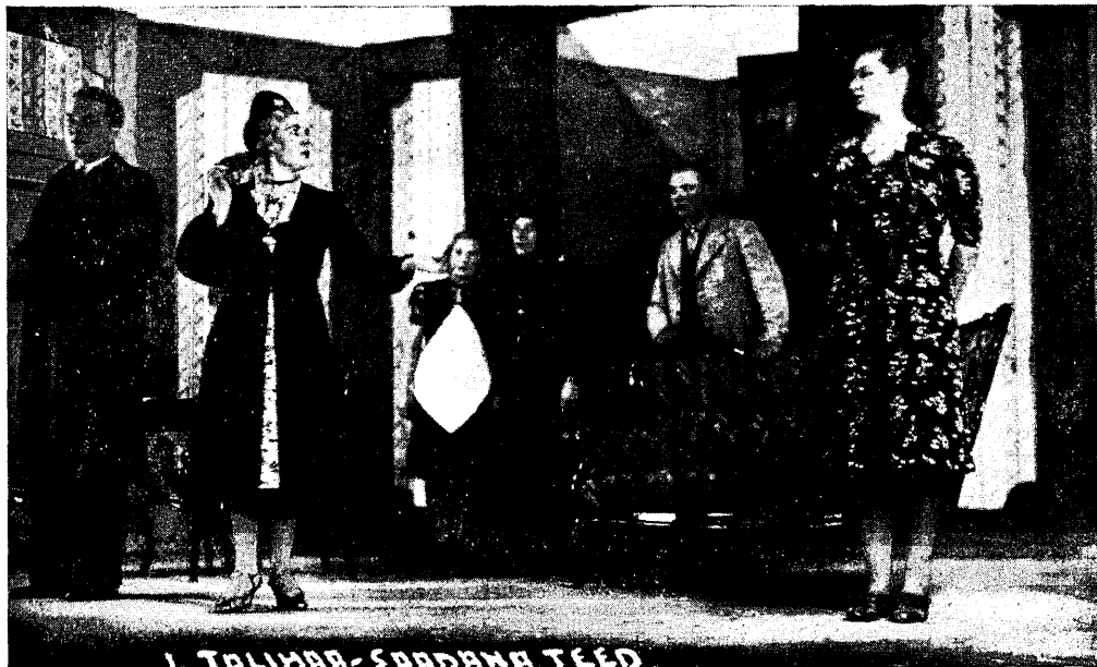
Stseen kolmandast vaatusest. Autori lavastus Pärnu „Nooruses“.