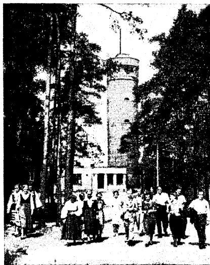
Eesti õpinglased Tampere, Pyyinikkil.