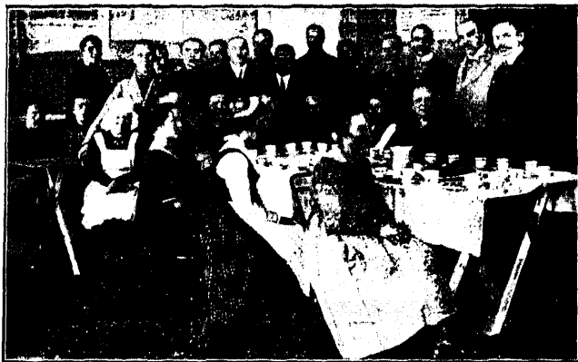
Satakunna noored pidulauas.

Vahetame taas rongi ja siirdume Tam- perest — Soome tööstuskeskkohast —