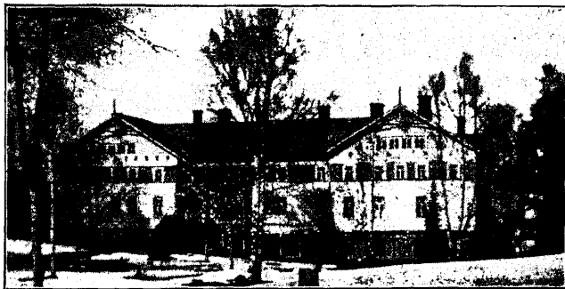
Tüübiline noorsookodu Soomes. Otava Noorsooühingu tööstuskooli maja.

fooniks soome värviküllastele rahvariietele. Lava omapärasust ja ilu lisab õhtupäikese kiirtes sädelev kullatud käbide ornament. Ei puudu ka lava praktilikkus. Nii muutus laulukooride ettekannete järel senine astmeline lava vastavate siseseadete abil mõne minuti jooksul põrandaks võimlemis- ja tantsuesitusile.