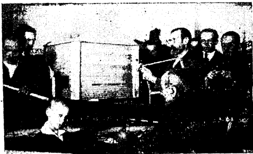
Saduküla noorsoolased mesipuid ehitamas. Seisab par. teine Saduküla agaram noorsooteg. V. Kurs.

1928 a. algas nii, kui eelmine aasta lõppes. Kõik näis vana rada edasi minevat. Olid kirjanduse j. t. harjutusõhtud; peeti 10. III. suurem, aastapäeva, pidu. Kuid pääle aastapäeva pidu hakkas juba avalikult paistma välja, et asi ei ole jälle korras — nagu oleks tahetud osak. olemasolu ja tegevust sumbutada ja salajases hoida. Ei antud soovijaile liikmearte, ja kui anti siis ainult „teatud isikuile“. Asi oli selge: osak. taheti uuesti likvideerimisele viia, kuid seekord juba teatud ettevalmistuste kaudu ja mis neil teatud määral ka kergem näis, sest kaks seda pooldavat isikut valiti juhatusesse. 1 apr. 1928 a. oligi osak. likvid. koosolek koos, ja seekord läks nende „vaga soov“ täide — osak. likvideeriti, aga mitte põhikirja kohaseid teid mööda. Seepärast ei tunnustanud seda Keskjuhatus ja Esitavkogu seaduspäraseks. Asjaga ei tahtnud kuidagi leppida ka tulisemaid ÜENÜ-lasi ja osak. liikme E. Reinde eestvõttel saadeti Keskjuhatusale likvid. üle protestkiri, mille põhjal alustatud juurdLuse tulemus oli, et 4. nov. 1928 a. oli osak. erak. pääkoosolek kokku kutsutud, kus tähistati 1 apr. tehtud otsused ja loeti osak. mitte likvideerituks. Osak. sai omale uued ruumid end. Saue mõisast, mille kasutaja, olles ise osak. esimees, osak. lahkesti vastu tuli, andes ruumid tasuta kasutada. Sellest peale algavad jälle rahulisemad päevad ja osak. võib oma tegevust jätkata. Korraldati Jüriöö mälestuse õhtu, võeti osa juubeli-pidustusist jne.