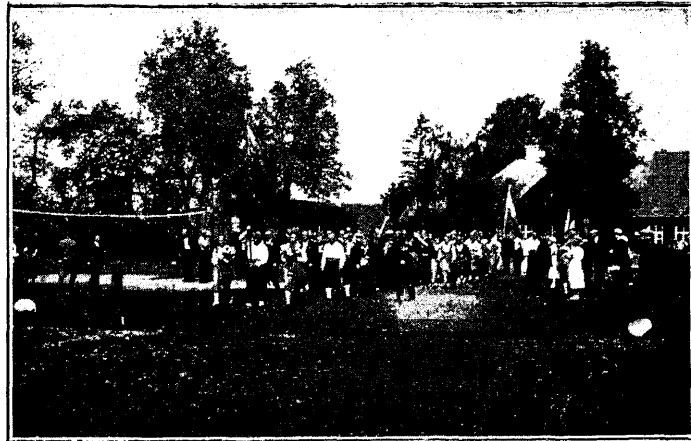
Rongkäik Varbola maalinna

Öhtul toimus Põllis pidu, mida sisustasid ÜEÜÜ Valtu osakonna näitlejad.