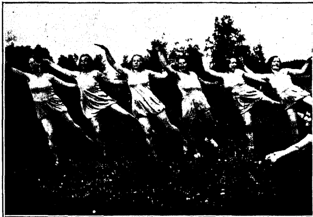
Hirvli osak. naisvõimlejad

Sportlikud võistlused toimusid hiljem kohaliku koolimaja mänguplatsil peakohtuniku nrs. Oolepi juhtimisel. Osakondadest tulid kohtadele: Raiküla 106,25, Märjamaa 90,5, Inglise 77,25, Valtu 29, Kaiu 24, Paluküla 13 ja Põlli 12,5 punktiga. Väljaspool võistlusi võtsid võistlusest osa lähedase „Plato” lastekodu kasvandikud, kelle saavutused mitmel alal olid tähelepanuvääriivad.