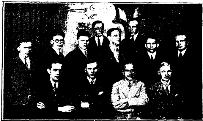
ÜENÜ Narva osakonna juhatus ja vanemate nõukogu

Aktusele järgnes ÜENÜTO poolt korraldatud vabaõhu esinemine Harjumäel, kuhu oli