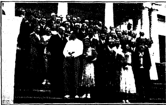
Võistlustest osavõtjad Õisu piimanduskooli trepil