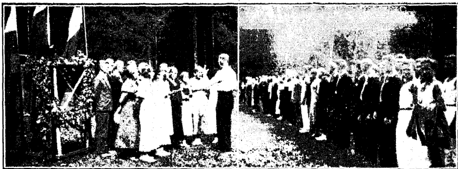
ÜENÜ Virumaa suvipäevadest osavõtjate rongkäik peoplatsil, esineb Palmse osak. laulukoor

kogunenud paartuhat inimest. Ed. Riismani avasõnale järgnesid ettekanded ÜENÜTO laulukoorilt ja rahvustantsurühmalt. Soome rahvustantse esitas Okeroiste naisrühm.