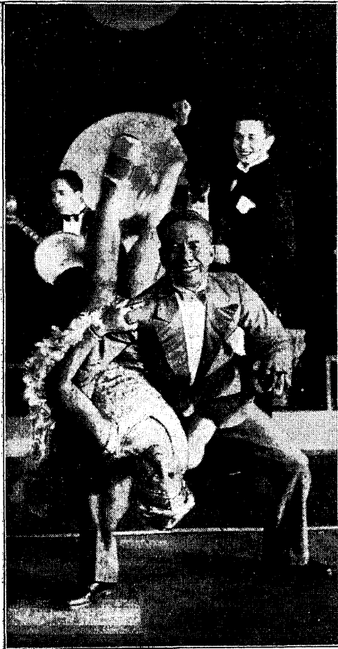
Mulati tantsupaar, kes mõõdunud aastal „Grand Marinas“ esinesid Soome helifilmis „Lai tee“.

Heli-nädala ringvaade vabastas helifilmi ilmumisega tumma nädalaringvaate. Ta võttis kohe oma võimusesse päevasündmused ja nõudis õigusega huvi avalikkuselt, kellele loodi see uus teadeteettekandmise viis. „Rääkiv ajaleht“ näitas uusi teid ja tema redaktorile, helifilmi reporterile, langes osaks tänulik ülesanne end tegelikult üles näidata sellel