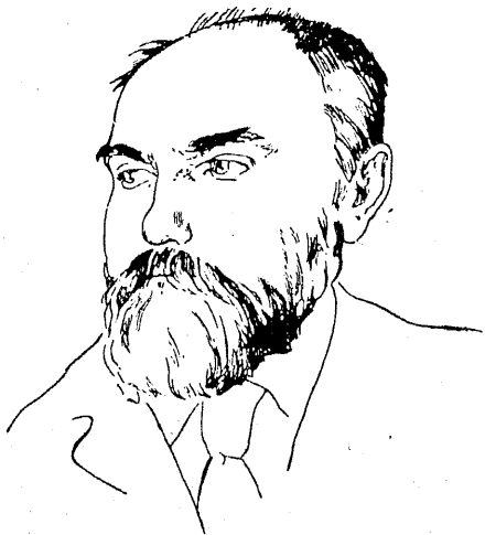
Sergei Ljapunov †

Heliloojana on Ljapunov terve rea sümfoonilisi ja muid helitöid loonud, mis eriti Vene kontsertide eeskavades kaunis sagedasti esinesid.