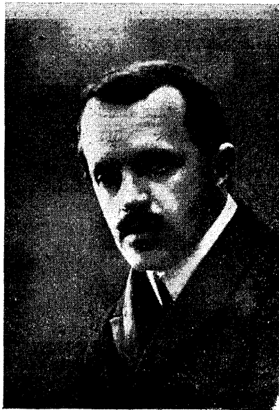
Prof. Erkki Melartin.

ning tõusnud nende läbi Sibeliuse kõrval tähtsamaks Soome heliloojaks. Peale selle on ta lugupeetud hea dirigendina ja muusika-pädagoogina. Viimasena on tal väga suured teened Helsingi muusikakoolis, mille juhatajaks ta on 1911. a. saadik ja mille ta on selle aja kestel suutnud tõsta väga heale järjele.