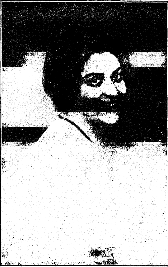
Kuulus lauljanna Sinaida Jurjevskaja,

kes selle kuu algul Schweitsis, kuulsa „Kuradi silla“ juures saladuslikul teel hukkus.