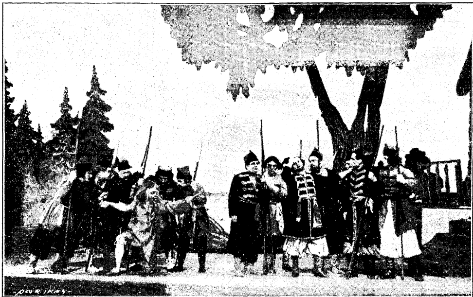
A. Dargomõzski ooper „Näkineiu“; stseen kolmandast vaatusest.

peolt, kus igatahes ei teadnud oodata sää- rast korralagedust. Haapsalu meeslaulu- päevale ülesannud neljast koorist puudu- sid kolm; kohalik juht oli koguni sõitnud ära. Kiitusega peab siin mainima üksikuid koore, kelle abil ja vedamisel siis ka kava kuidagi esitati. Olgu siin need üksikud ju- hud toodud selleks, et pillikooride juhid sellest ka teaksid oma järeldused teha.