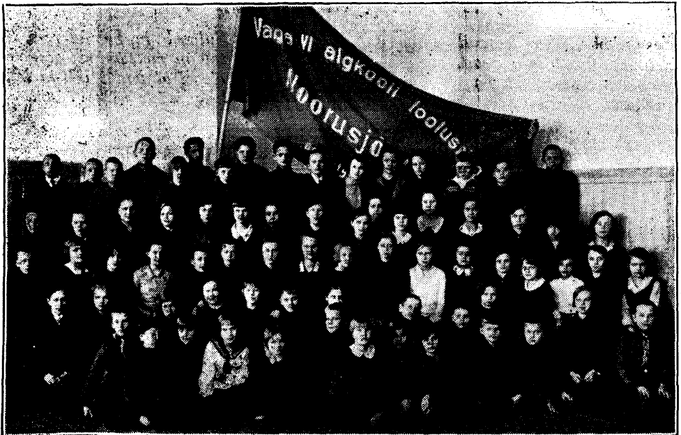
Valga linna VI algkooli osa lootusringlasi 1932. a.