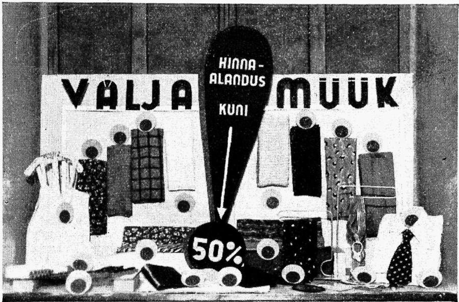
Vaateaken: Riidekaupu väljamüügiks.

„Väljamüügi aknad“ moodustavad erineva akende liigi, kus pearõhk on kauba liikide, erinevate artiklite rohkusel. Selle kõrval on aga puht ostja psühholoogilisest küljest veelgi suurem tähtsus hinnasedelitel, millised väljamüükide kõrval omavad mõnikord otse maagilise külgetõmbejõu. Seepärast olgu väljamüügi aknal sõna „väljamüük“ ja hinnasedelid eriti silmatorkavad. Kõige mõjuvam viis on sõna „väljamüük“ ja hinnaalanduse % kleepida otse akna klaasile. Kaupade väga suure mitmekesiduse tõttu kipub akna üldilme sageli muutuma „pudi-padiliseks“. Tuleb aga siiski püüda säilitada selget ja rahulikku joont, mida saab eeskätt kaupade rühmitamisega ja lihtsa asetusviisiga.