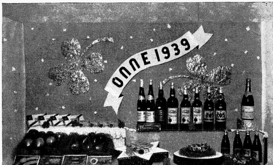
Vaateaken: koloniaalkaupu ja maiustusi.

Vaateaken on määratud uueks aastaks, mida näitavad vastavad embleemidki — ristikheinalehed. Hiljem võib ristikheinalehed eemaldada ja uuendada tekstilint, tehes seda suuremaks ja laiemaks, jättes muutmata aga lindi kuju ja liikumise. Tekstiks uuele lindile võib panna seekord näit.: „Maiasmokkadele!“