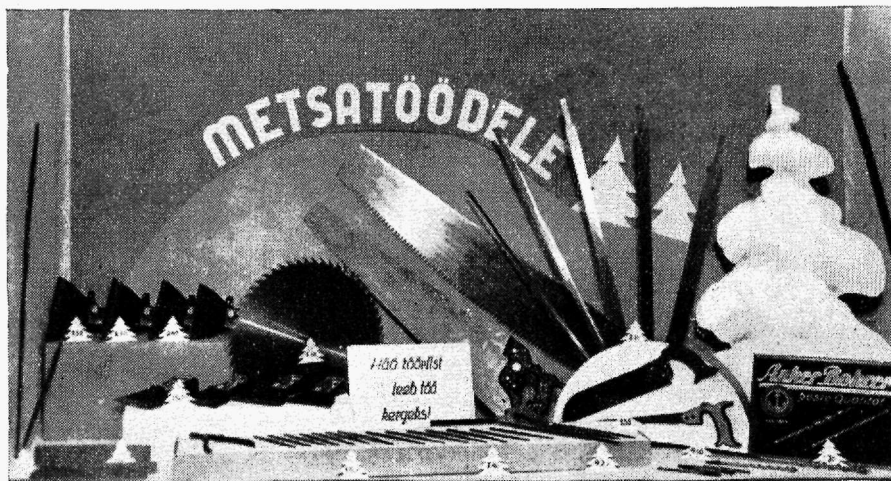
Vaateaken: metsa- ja käsitööriistu.

Aknal on pearõhk pandud metsatööriistade esitamisele, nagu sellele viipab lööklausegi, vähemal määral on puht käsitööriistu. Ent siingi võib kaupade valikut rikastada: võib siia välja panna kõiki kaupu, mis sobivad juba olevate kaupadega.