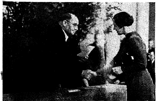
Traditsiooniline rektori käepigistus noorele üliõpila- sele alma materi jüngriks astudes.

Üldiselt on vaenutegevus takistanud paljudes riikides õppetööd ja välismaal õppivad eestla- sist üliõpilased on sunnitud jääma kodumaale. Eriti teravalt puudutab see asjaolu neid üliõpi-