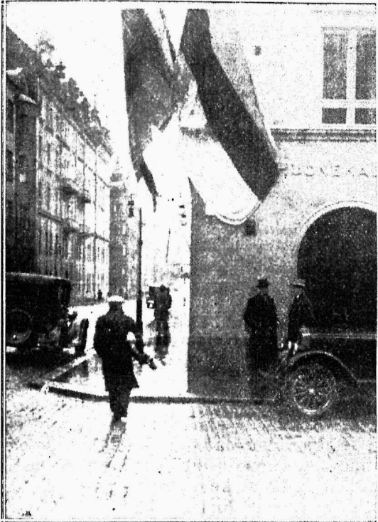
Soome Maakogud. Liidu maja Soome M. L. III. kongressi puhul.