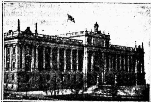
Rootsi Riigipäevahoone, kus kongress ärapeeti.