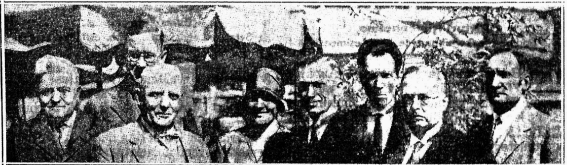
Väliskülalised Rootsi Maaomav. Liidu III. kongressil 26—28 juunini 1930.

Rootsimaa omavalitsuste korraldus ja vahekorid keskvoimuga, võiks meile meie