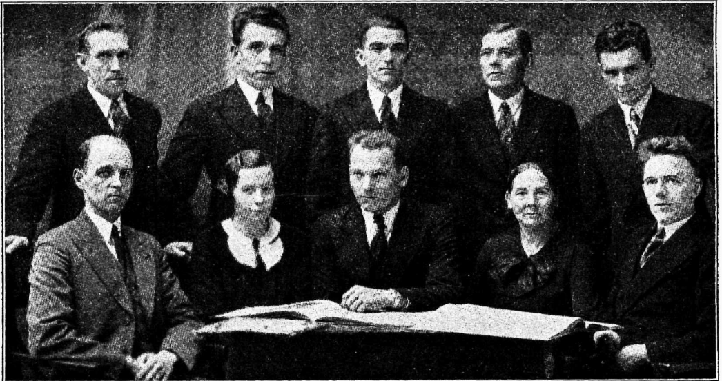
Narva Kreenholmi käitise töölisnõukogu.

Sellele peab tulema lõpp. Teadlikumad töölised, kes olid seni ühistegelisel organiseerimata, peaksid juba praegu astuma tarvitajateühingu liikmeks. Nad ei tarvitse oodata, kuidas areneb ühistegevuse selgitustöö ja kui palju suudavad ja tahavad selleks kaasa aidata ühistegelised keskasutused. Kellel on asi praegugi selge — see astugu ligema ühiskaupluse kaudu tarvitajateühingu liikmeks ja värbigu ühistegelasteks oma naabreid ja selt-simehi käitisest ja kutseühingust.